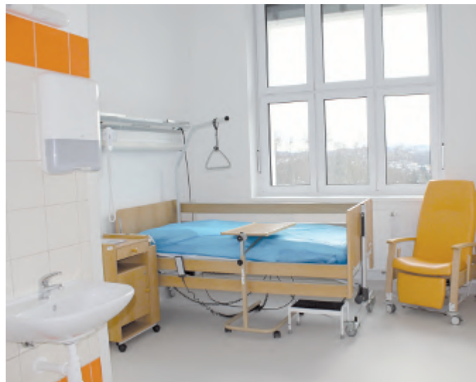
Jedno až třílůžkové pokoje mají vlastní moderní sociální zařízení