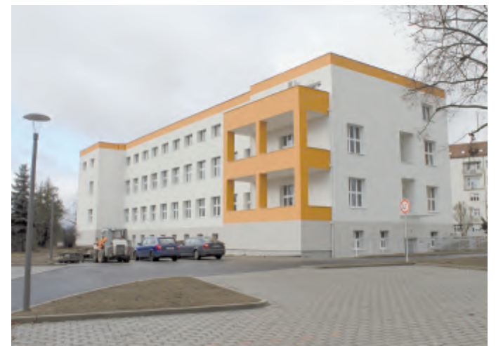
V areálu nemocnice byly zároveň vytvořeny nové parkovací plochy a opraveny komunikace

Předáním „třináctky“ ale modernizace Nemocnice Havlíčkův Brod nekončí. V následujících letech plánuje Kraj Vysočina rekonstruovat gynekologicko-porodnické oddělení, perinatologické centrum a čekají ho také stavební úpravy pro magnetickou rezonanci. (KÚ/ foto: mal)