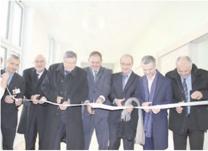
Přestřižením pásky byl v pondělí 12. prosince slavnostně zahájen provoz ve zrekonstruované budově bývalé ortopedie

Necelý rok trvala Kraji Vysočina generální rekonstrukce Pavilonu 13 Nemocnice Havlíčkův Brod. V původním objektu se s respektováním originálního půdorysu z roku 1933 podařilo citlivě připravit pracoviště a zázemí pro 50 lůžek plicního oddělení a oddělení následné péče a rehabilitace (LDH), a to včetně odborných ambulancí oddělení kožního, endokrinologie nebo ambulance bolesti. Podle informací hejtmána Kraje Vysočina Jiřího Běhounka přišla rekonstrukce Kraj Vysočina na téměř 90 miliónů korun.