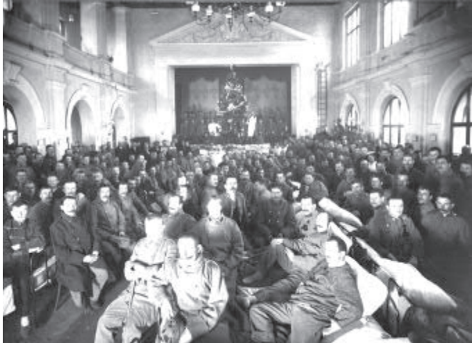
Štědrý den vojáků v brodském lazaretu v budově sokolovny (dnes klub Oko) na Smetanově náměstí. Pod vánočním stromkem na jevišti se šlo od místních dobrodinců v roce 1914 ještě dosti hodnotných dáreků. O dva roky později byla nadílka již podstatně skromnější.

Vánoce, ty svátky pokoje a dobré vůle, doba, kdy jeden druhému je nějak blíže s pochopením pro jeho osud, ochoten k nezištné pomoci. Takový je obvyklý obraz nejpoetičtějších svátků v roce, do něhož se i každý z nás podle svého založení snaží situovat