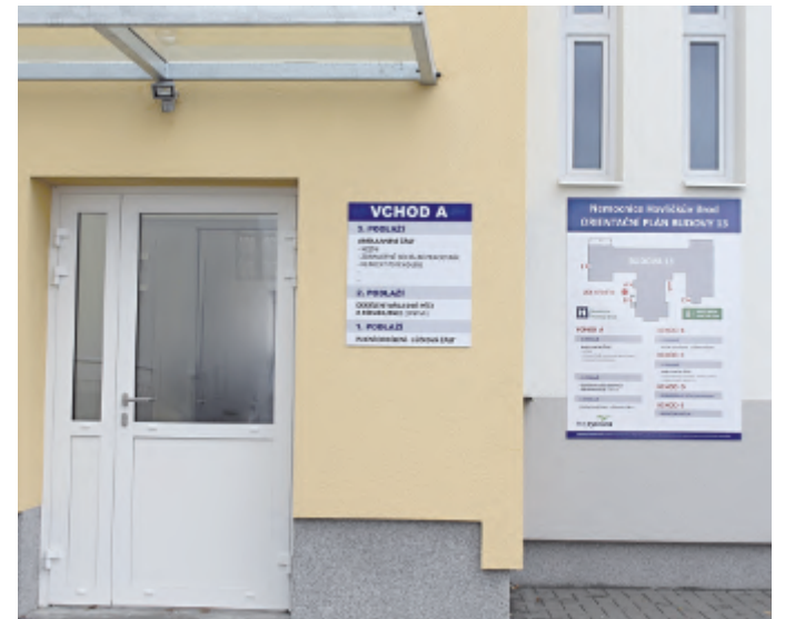
Hlavní vchod do budovy