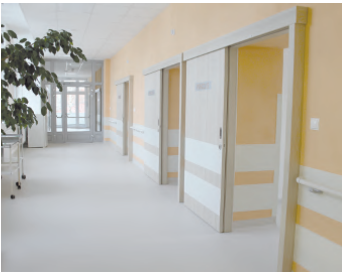
Díky posuvným dveřím se opticky zvětšil prostor společných chodeb