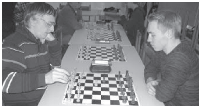
První dva vítězové turnaje