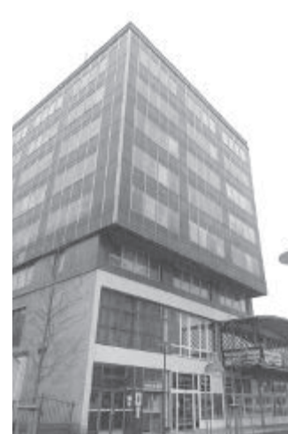
Budovu na Smetanově náměstí 261 Finanční úřad opouští

zemí historické budovy ve Štáflově ul. 2003. Od pondělí 9. ledna 2017 budou pro daňovou veřejnost na nové adrese přístupná oddělení majetkových daní, oddělení vyměřovací I (fyzické osoby), oddělení vyměřovací II (právnícké osoby) a pokladna pro příjem hotovosti. Plný provoz Územního pracoviště bude zajištěn dnem 16. 1. 2017.