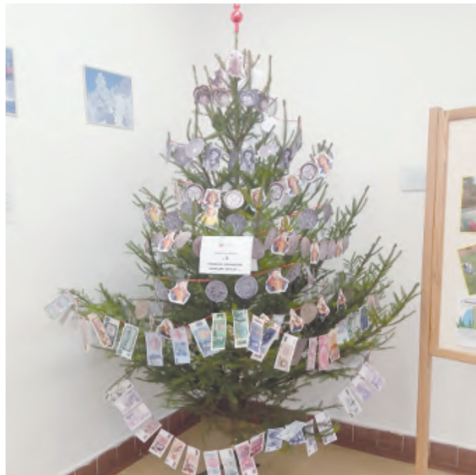
Originální vánoční stromeček s názvem „Finanční stromeček aneb jak šel čas...“