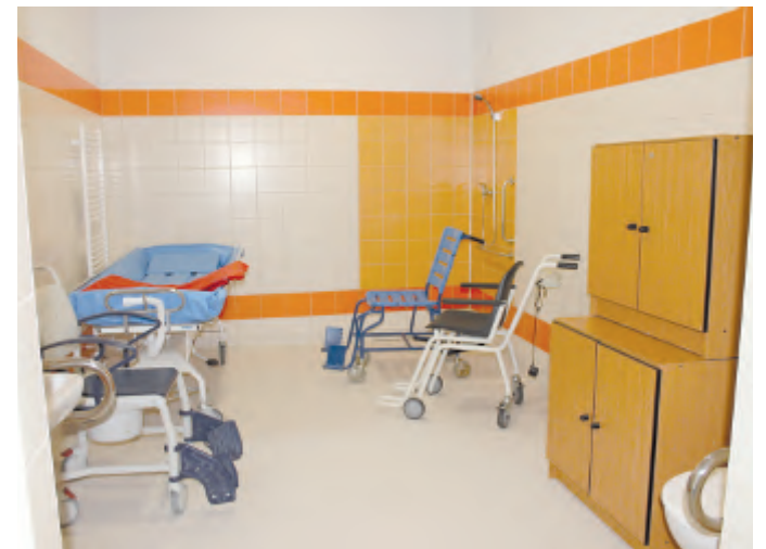
Velkoryse prostornou koupelnu si pochvalují zejména sestřičky, pečující o imobilní pacienty