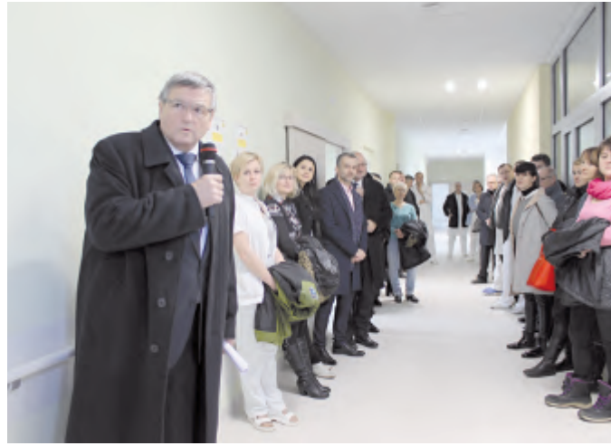
Podle informací hejtmána Jiřího Běhounka přišla Kraj Vysočina kompletní rekonstrukce na téměř 90 miliónů korun

Druhé podlaží, které je už na rozdíl od zbytku budovy téměř kompletně zařízené, začalo hned po zahájení sloužit pro následnou péči a rehabilitaci. Oddělení disponuje 26 lůžky, z toho tři lůžka jsou určena výhradně pro paliativní péči. Jsou v odlehlejší části oddělení a prostor byl vybrán s maximální ohleduplností k sou-