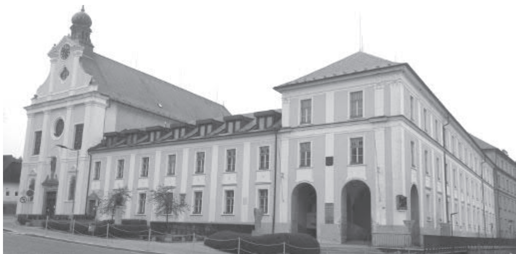
Od ledna 2017 bude Finanční úřad v budově Štáflova 2003

Územní pracoviště Finančního úřadu pro Kraj Vysočina v Havlíčkově Brodě se bude v termínu od pondělí 2. ledna 2017 stěhovat do nových prostor, a to na adresu Štáflova 2003, Havlíčkův Brod. Na této adrese byl v minulosti umístěn Okresní úřad, nyní se zde nachází Úřad pro zastupování státu ve věcech majetkových či Okresní státní