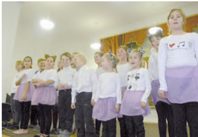
K programu přispěly i žákyně ze základní školy.