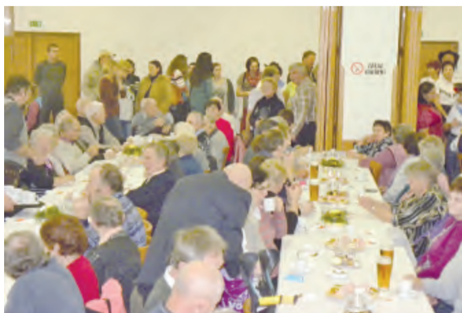
Seniory z obcí mikroregionu Krupsko se spolu dobře bavili.