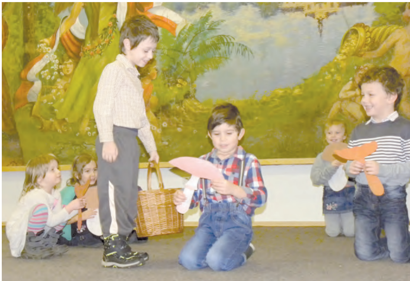
Vystoupení dětí z mateřské školy potěšilo všechny seniory.