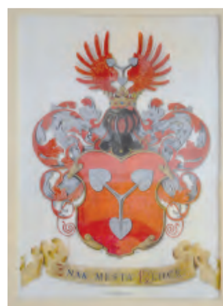
Vyobrazení znaku v ledečském turistickém informačním centru