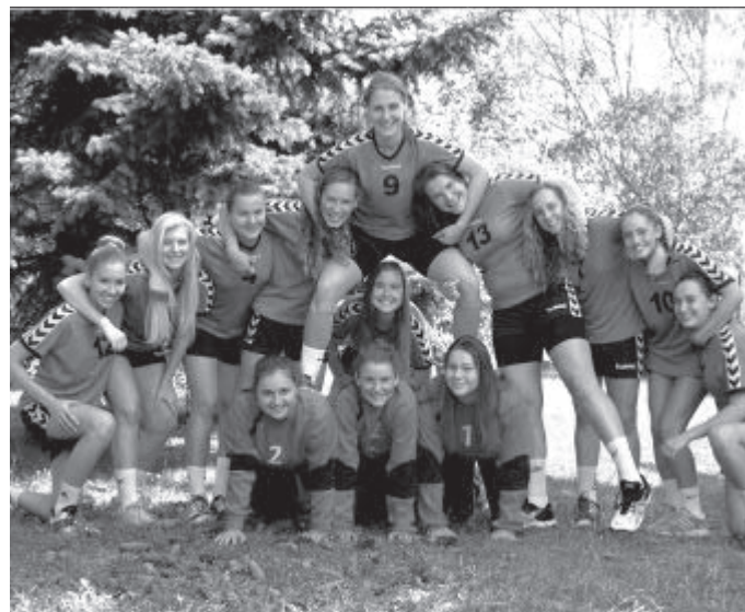
TJ Jiskra Havlíčkův Brod - Sokol Písek 25:31 (13:15)