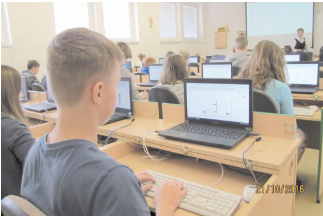
Soutěžící v plné práci