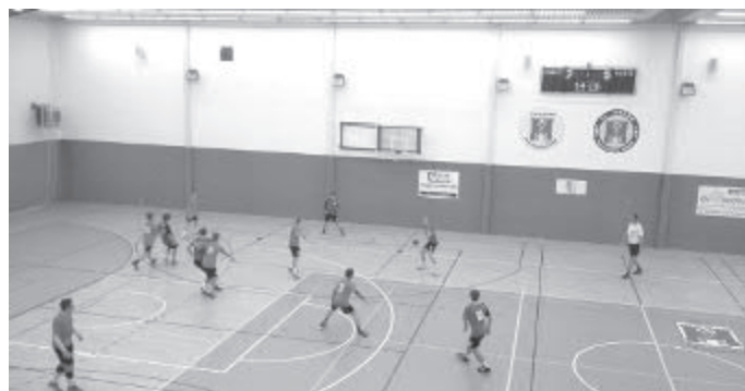
Havlíčkův Brod - Třeboň 26:25 (16:11)

V sobotu 22. 10. 2016 se hráli naši mladší dorostenci důležitý zápas, který vyhráli a získali tak své první vytoužené body. Velká gratulace!