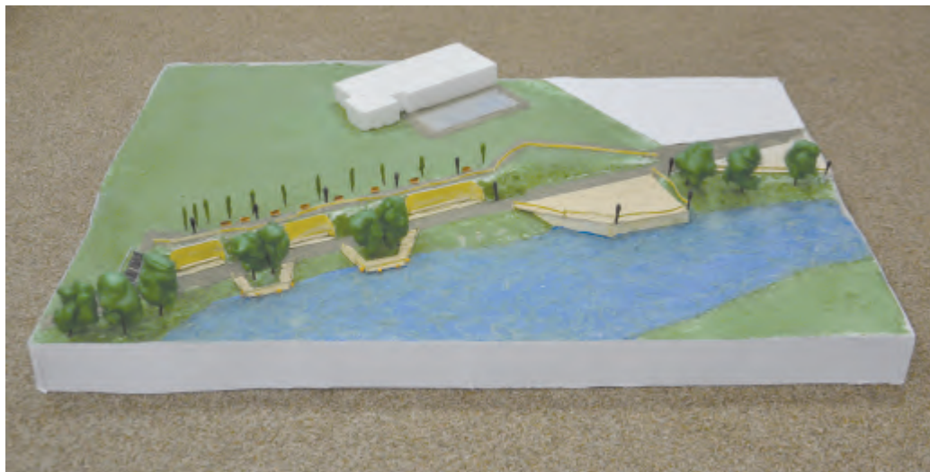
Autor Nicolas Vrána

Světlá nad Sázavou (jv) – Tak se jmenuje výstava, která byla zahájena minulý úterý ve velké zasedací místnosti Městského úřadu ve Světlé nad Sázavou. Představuje návrhy studentů světelské Uměleckoprůmyslové akademie, jak by si představovali budoucí vzhled lokality Pěšinky v úseku od kostela sv. Václava k Poštovní ulici.