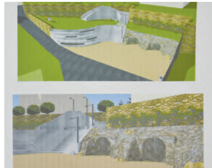
Vizualizace prostranství za kostelem