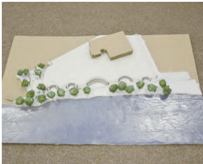
Autorka Simona Pišelyová