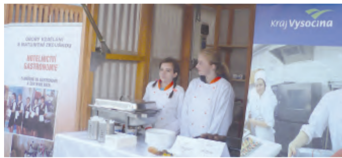
Svůj stánek měla Obchodní akademie a Hotelová škola Havlíčkův Brod ve kterém studenti nabídli své kulinářské výrobky