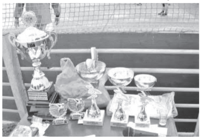
Putovní pohár, plakety pro smečáře a zadáka, pohár pro vítěze, druhé a třetí místo, medaile a diplomy pro všechny týmy.