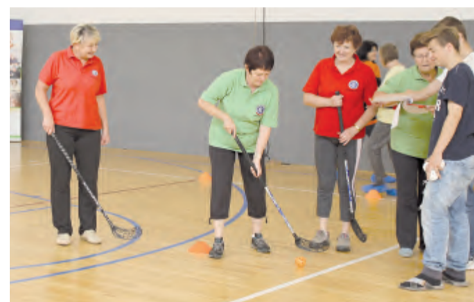
Florbalovou hokejku držela většina seniorů poprvé v životě.