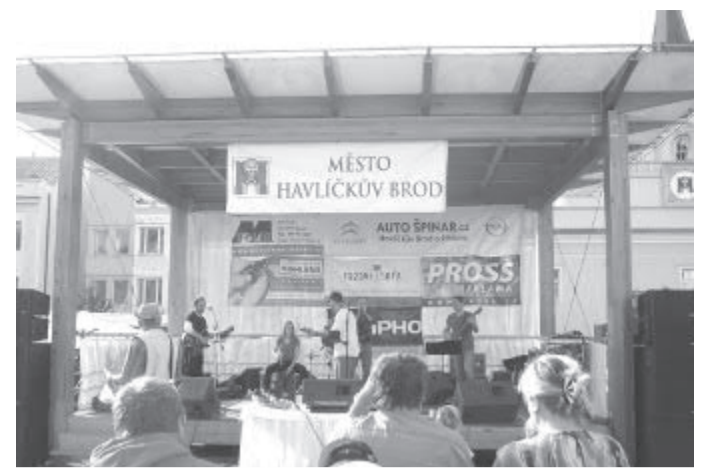
Hudební příznivci si poslechl několik koncertů