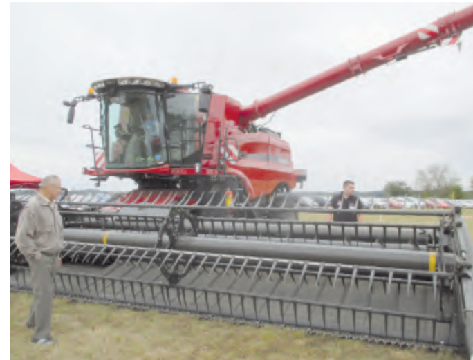
Nedílnou součástí chovatelského dne byla přehlídka zemědělské techniky.