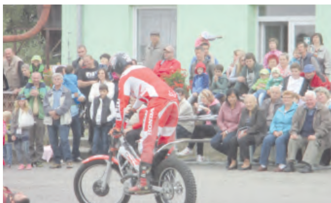
Svou obratnost na motocyklu předvedl desetinasobný mistr republiky v motokrosu Miroslav Lisý.