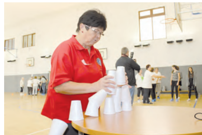
Skládání pyramidy z kelímků je v podstatě velmi jednoduché - pokud nesvazuje ruce obava o co nejlepší čas pro celý tým.