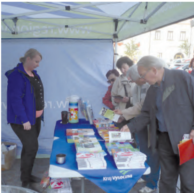
Kraj Vysočina ve svém stánku nabízel zdarma mapy a turistické průvodce