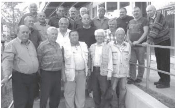
Společné foto účastníků srazu Drakyáda 2016

V sobotu 1. října 2016 ve 14 hodin v restauraci Rozvoj v Havlíčkově Brodě měli setkání muzikanti, kteří hráli ve Vojenské hudbě. Asi už jen pamětníci znají historii Vojenské hudby v Havlíčkově Brodě.