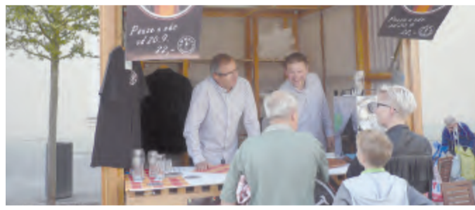
Velkou pozornost návštěvníků měl stánek brodské pivnice U Hnáta, protože nabízeli svoje pivo Hnát