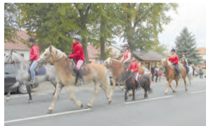
I letošní program byl velmi bohatý, velice se vydařil a líbil se dospělým i dětem