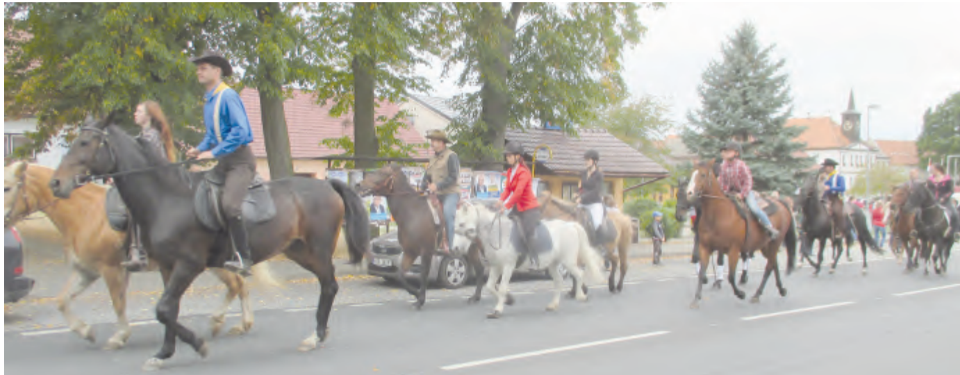
Nejkrásnější pohled je opravdu z koňského hřbetu. A v takovém duchu se nesl i 26. ročník Chovatelského dne.

Nedílnou součástí celé akce byla přehlídka současné zemědělské techniky.