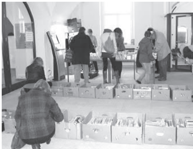
Ve vestibulu Staré radnice nabýzely knihovnice vyřazené tituly z knihovního fondu.

Krajská knihovna Vysočiny stejně jako další knihovny působící v Kraji Vysočina svými aktivitami podpořily Týden knihoven 2016. Letošní jubilejní 20. ročník připadl na týden od 3. do 9. října. „Jedná se o celostátní akci vyhlášenou pravidelně Svazem knihovníků a informačních pracovníků ČR, která se zaměřuje na podporu a propagaci knih a čtenářství. Cílem aktivit knihoven, i těch vysočinských, je nabídnout novým i stávajícím čtenářům atraktivní způsob