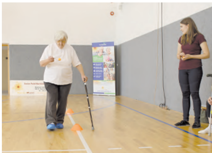
Slalom s míčkem na lžici se dá zvládnout i při chůzi s hůlkou.

něné i dopolední svačinu a oběd ve školní jídelně. Akce se konala pod záštitou starosty města Havlíčkův Brod Jana Tecla, finančně významně přispěl Kraj Vysočina a hlavní ceny pro vítěze zasponzoval Aeroklub (hodina golfu pro vítězný tým) a Žižkovská hodovna a řízkovna (pohoštění pro celý tým v hodnotě 500 Kč).