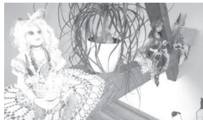
Návštěvníci najdou v podkroví knihovny mnoho krásných, ručně šitých panenek.