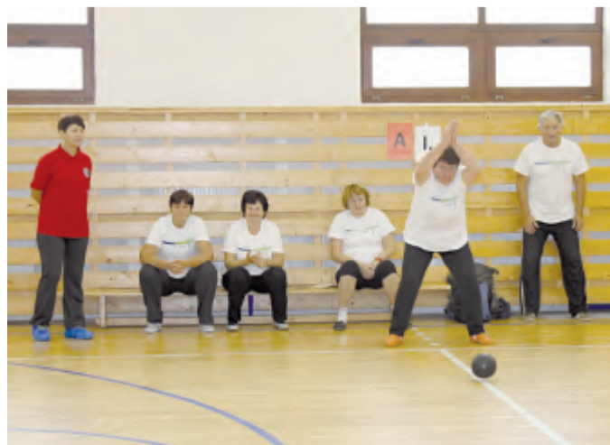
Třetí kuželky přes celou šíři tělocvičny - to chtělo pořádný náprah.