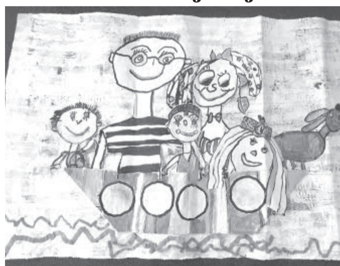
Vítězná práce „Rodina“ ve výtvarné kategorii - kolektivní dílo MŠ Šmolovy