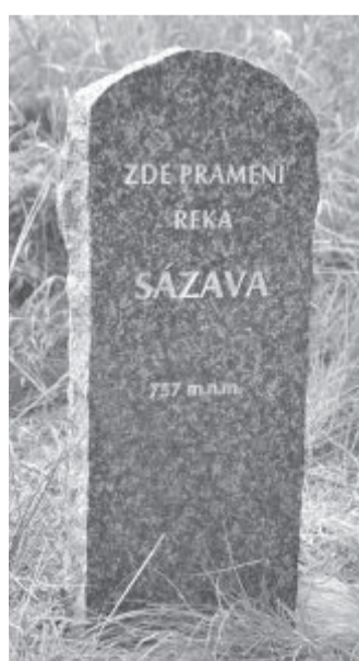
Označení pramenu žulovým kamenem