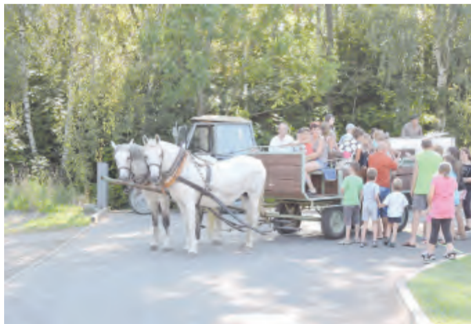
Koňský povoz měl úspěch u dětí i dospělých

Tradiční rozloučení s prázdninami se uskutečnilo v Habrech v sobotu 27.8. 2016 odpoledne v areálu pod hasičskou zbrojnicí. Předposlední prázdninový víkend se vzhledem k velice pěknému teplému počasí vydařil. Děti si loučení s prázdninami užily. Více jak dvě stovky rodičů s dětmi