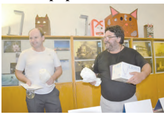
Šťastní majitelé vylosovaných cen, které věnovali sponzoři