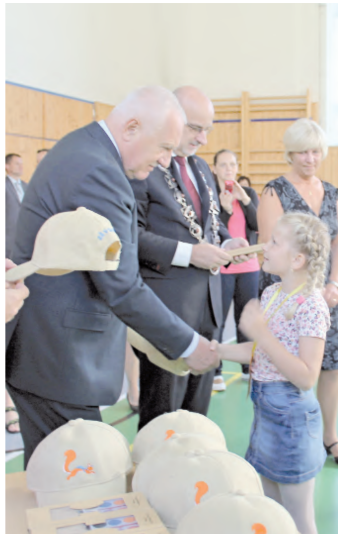
Tak jako Verunka, i ostatní prvňáčci ze všech čtyř tříd Základní školy V Sadech dostali tradiční kšiltovku s veverkou - logem školy. Letos jim je rozdával ex-prezident Václav Klaus. Ten přijel 1. září do Havlíčkově Brodu a kromě školy navštívil i Pleas a Muzeum Vysočiny. (...více uvnitř listu) (text a foto: mal)