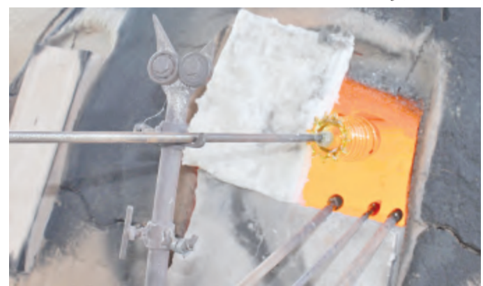
Před každou další úpravou musí sklenka zpět do pece