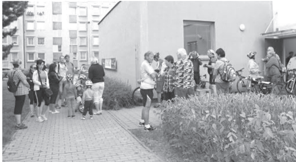
Na pěši i cyklotrasy 47. Havlíčkobrodské padesátky se v sobotu 3. září od budovy Městského úřadu V Rámech vydalo celkem 324 malých i velkých turistů.