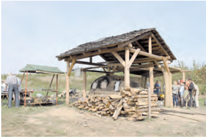
V pátek ráno bylo vše připraveno na experimentální tavbu i příchod návštěvníků