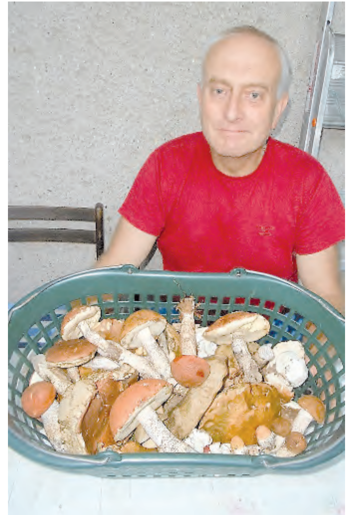
Křemenáče stále rostou.

Letopočet 1226z nejstarší dochované písemnosti papeže Honoria III. o obci Herálec napovídá, že před 790 roky patřila želivskému klášteru. Podstatně mladší snímek Mgr. Palátkové z konce prázdninového srpna je ze sluncem ohříváné herálecké pouti s lákavými atrakcemi - včetně aquazorbingu. Dodejme, že ty velké plastové koule umožňují zručným uživatelům nejen „chůzi“ po vodě. Aquazorbing vznikl v Asii roku 2006 a o dva roky později se objevil u nás. JKt / NET