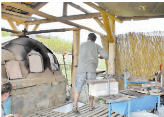
V popraskané peci už je do ruda roztavená sklovina