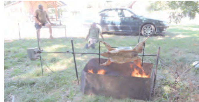
Rožnila se ovečka