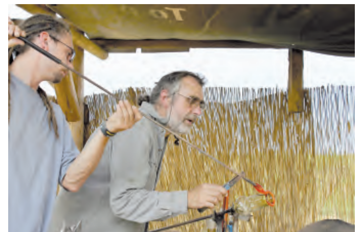
Na vyfouknoutou sklenku se další roztavenou hmotou přidávají ozdobné prvky