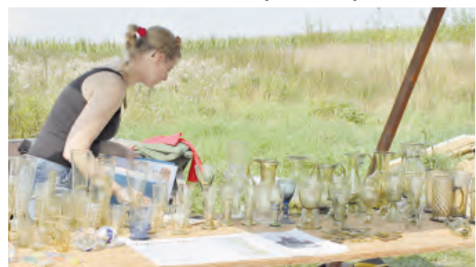
Hotová práce sklářského mistra - krásně zdobené nazelenalé sklenky a vázičky z tzv. lesního skla

Zaměření, stavba přístřešku a zděnění topného kanálu proběhlo během 14