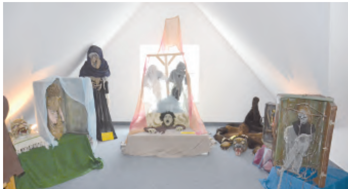
Část expozice strašidel