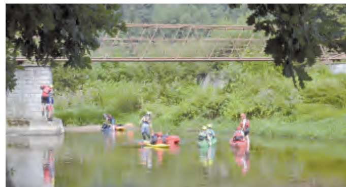
Vodáci u lávky ve Vilémovicích