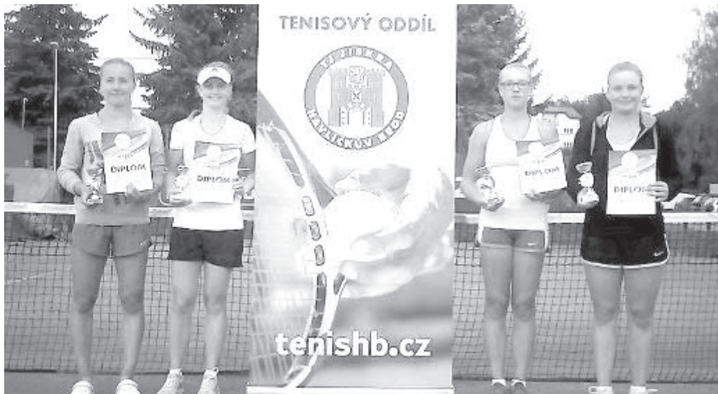
Finalistky dívčí čtyřhry.

Havlíčkův Brod (PeKy) - O víkendu 6.-8. srpna se uskutečnil na kurtech brodské Jiskry celostátní turnaj dorostu REBUT CUP 2016. Turnaj měl pěknou účast v podobě 34 hráčů a hráček.