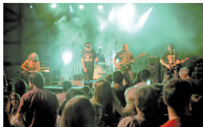
Pumpa potěšila nejen pamětníky