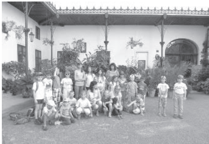
Materské centrum Zvoneček patří pod Oblastní charitu Havlíčkův Brod má již třetím rokem ve své letní nabídce příměstské tábory. Je o ně velký zájem a poptávka po nich převyšuje kapacitu táborů. Opět se jeden z nich uskutečnil v červenci a druhý v srpnu.