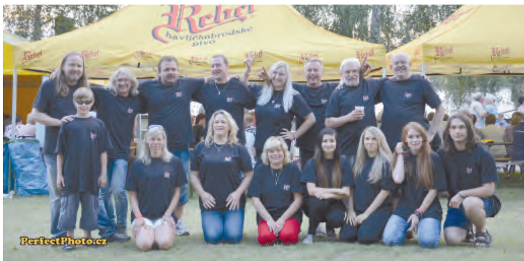
Poděkování za organizaci festivalu si zaslouží tým STOCK 2016

V Dobrohostově u Havlíčkova Brodu se uskutečnil ve dnech 12. až 14. srpna 2016 malý letní festival STOCK 2016.