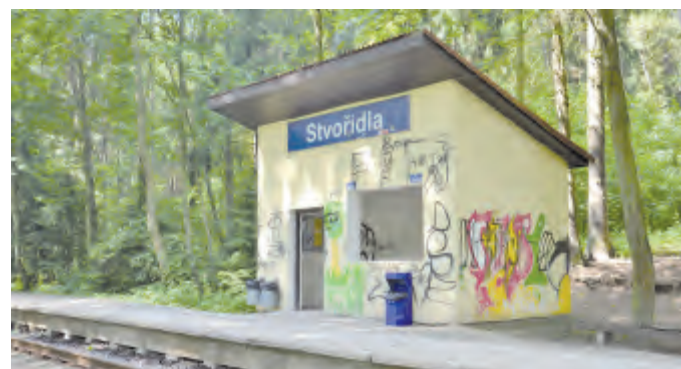
Čekárna Posázavského pacifiku