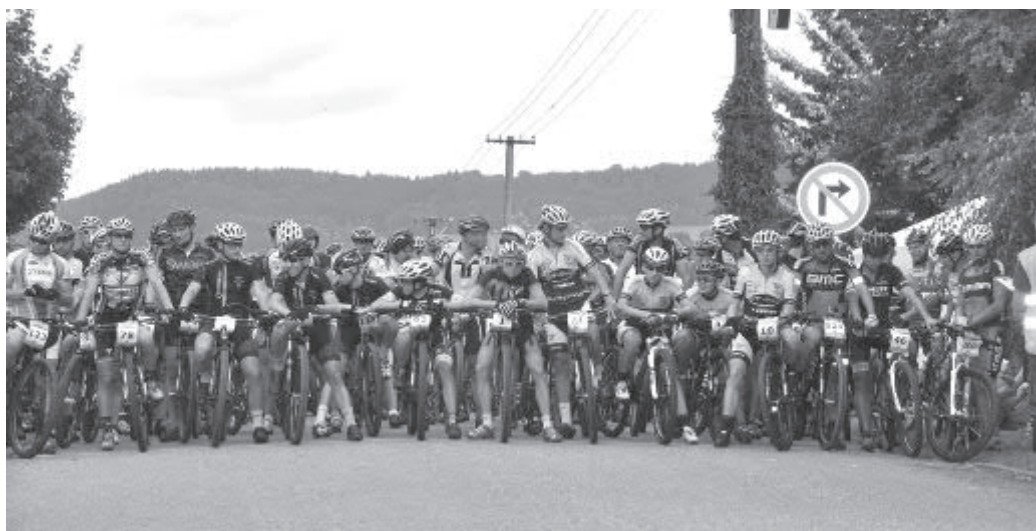
Letos se účastnilo rekordních 287 jezdců