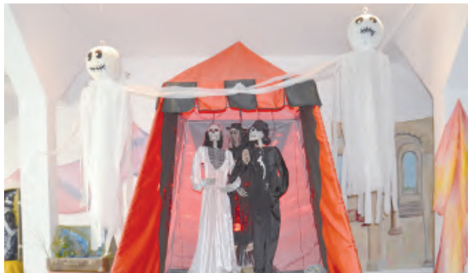
Láska až za hrob

Galerie je v přístupná od úterý do pátku od 9 do 17 hod, v sobotu, neděli a ve svátek od 13 do 17 hod.