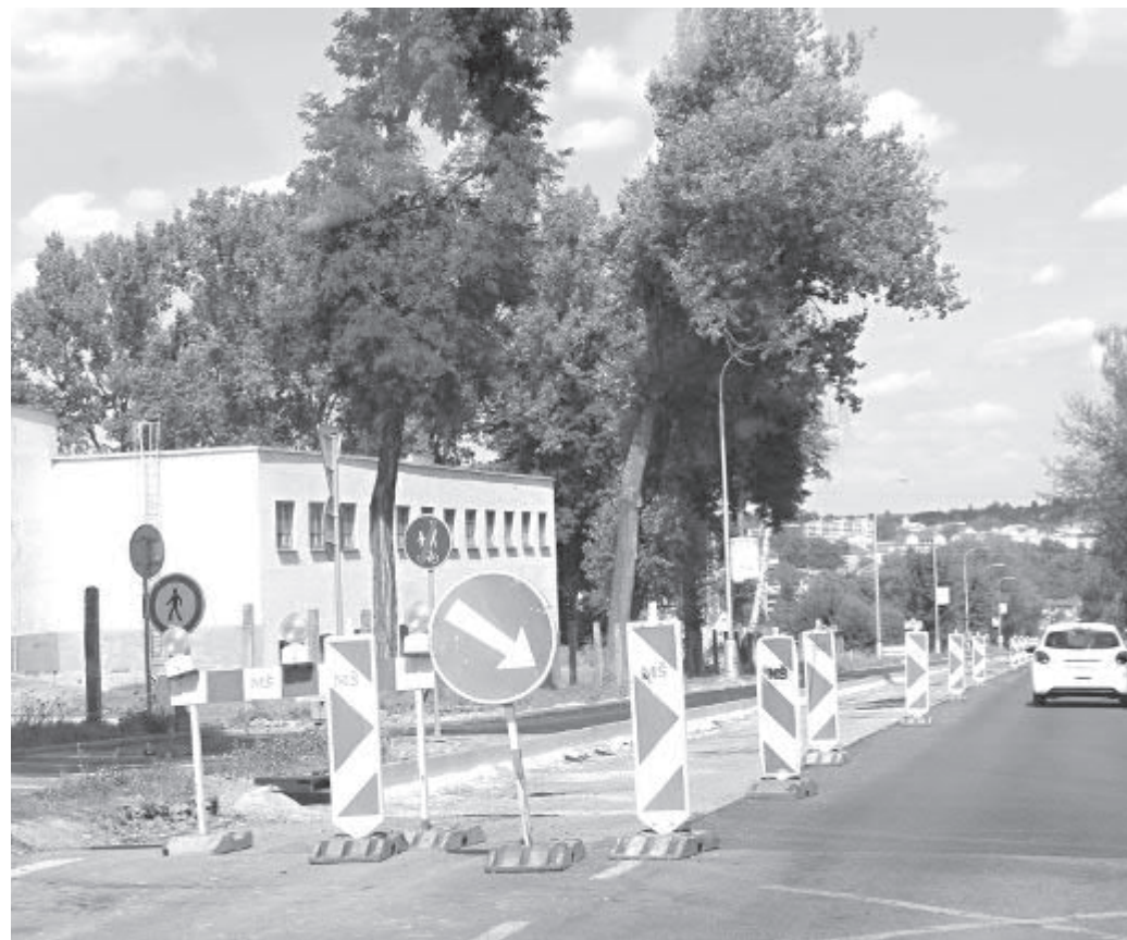
Stavební práce na Humpolecké ulici jsou už v druhé etapě - teď probíhají na levé polovině vozovky ve směru jízdy od Humpolce. Křižovatka Humpolecká – Ing. Kašpara je pro veškerý provoz uzavřena, vjezd a výjezd vozidel ze čtvrti Pod Letištěm je možný pouze ulicí Lipnická. (text a foto: mal)

chodníku. Nyní probíhají práce před pokládkou asfaltobetonu. Poté dojde k pokládce ložných vrstev komunikace, pokládce obrusné vrstvy a bude doděláno dopravní značení. Práce probíhají podle harmonogramu. Uzávěrka skončí 18. 9. 2016. (MÚ)