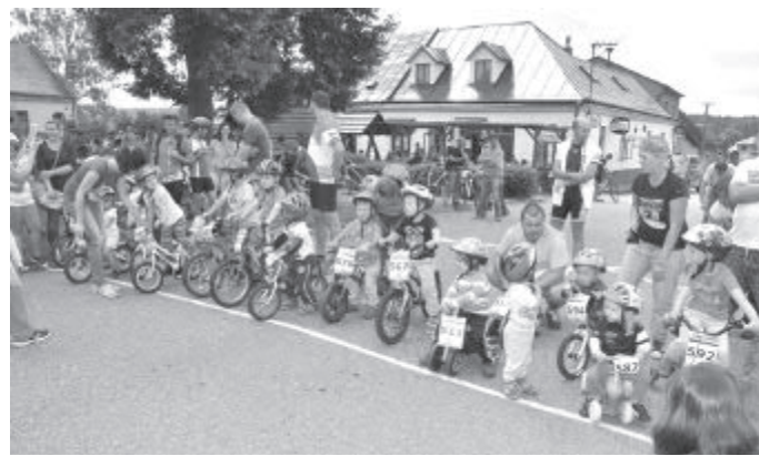
Benjamínci měli největší úspěch u diváků