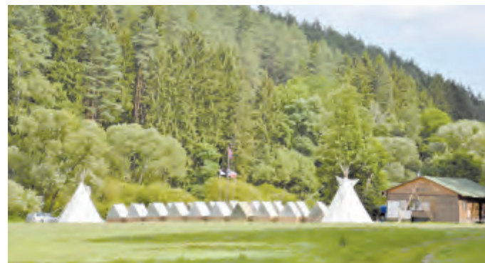
Tábor u ústí Kouteckého potoka