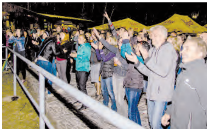
V pátek 12. srpna se ochladilo a diváci se museli obléci do bund