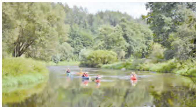
Vodáci mezi Stvořidly a Vilémovicemi