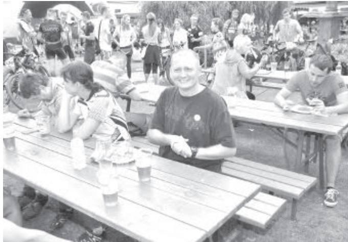
Dobré jídlo a pití po závodě přišlo vhod

V sobotu 13. srpna 2016 se uskutečnil již 13. ročník závodu horských kol Okolo Libice nad Doubravou.