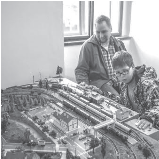
Například i tato souprava se v neděli rozjede.

Chotěboř – Rozloučení s prázdninami připravilo Městské muzeum Chotěboř na poslední srpnovou neděli. Malí i velcí budou mít 28. srpna jednu z posledních možností vidět výstavu Máme rádi vláčky.