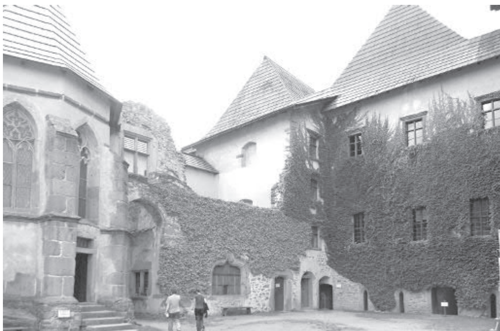
Lipnický hrad je přitažlivou středověkou kulisou pro filmaře z celého světa.