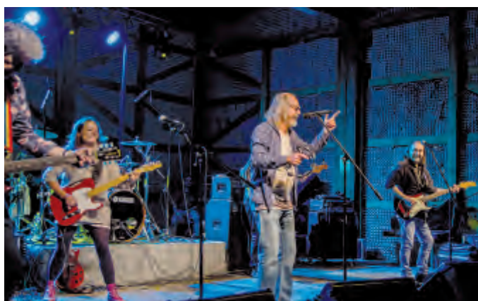
Žlutý pes byl páteční festivalu hvězdou