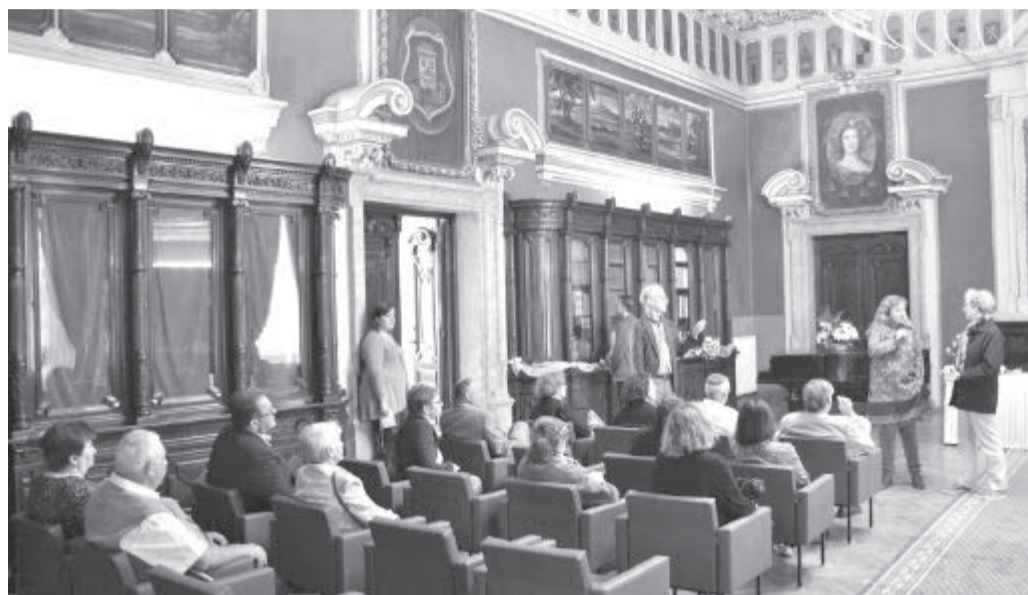
Na zámku v Rytířském sále.