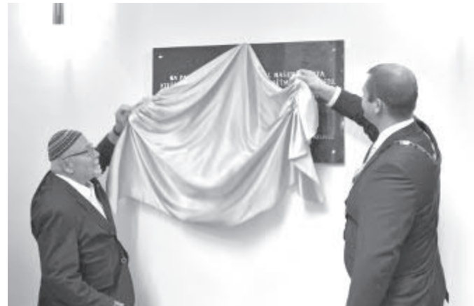
Okamžik odhalení pamětní desky.