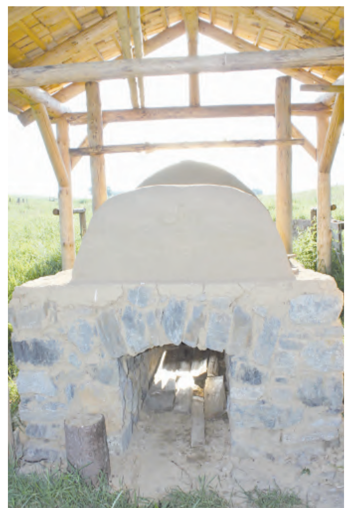
Výzděný topný kanál.

Jejích zastřešená replika pece je dlouhá 3,5 m a vysoká zhruba 2 m. S přípravou na stavbu pece začali už loni. Jenom hledání správného místa a vyřízení všech formalit se stavebním povolením trvalo půl roku. V září začali stavět za pomoci zednické firmy - vyzdili topný kanál, a potom několik dní štípali dřevo, které věnovalo město a uskladnily technické služby. Teprve letos na jaře dostavěli vrchní část. Spoustu práce provedli sami pracovníci muzea s dalšími nadšenci, a s materiálem a financemi pomohla nezištně řada jednotlivců i firem. I proto by byl Jiří Jedlička rád, kdyby se jejich záměr podařil. Ještě nikdo totiž takový experiment - s replikou středověké