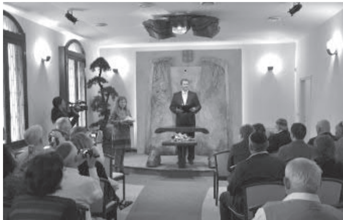
V obřadní síni světské radnice.

V pondělí 20. června byla ve vestibulu světské radnice odhalena pamětní deska věnovaná obětem holocaustu ve Světle nad Sáza- vou. V červnu 1942 bylo třemi transporty odvečeno šedesát šest židovských obyvatel, z nichž pět- apadesát se již nikdy nevrátilo.