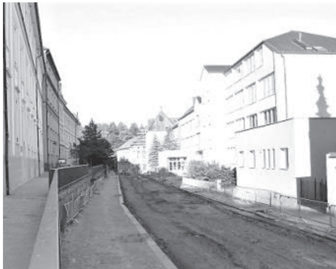
Až do 11. prosince bude ulice Štáflova v Havlíčkově Brodě z důvodu rekonstrukce inženýrských sítí, komunikace a chodníků uzavřena pro veškerý provoz. Autobusy, zajišťující k plaveckému bazénu, mají náhradní parkovací stání na parkovišti v Chotěbořské ul. (Text a foto: mal)