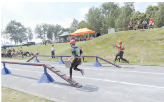
Soutěž žen v disciplíně 100 metrů překážek.