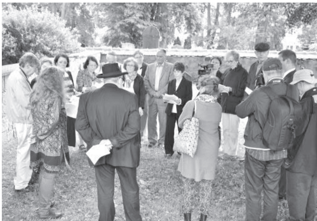
Čtení jmen světských obětí holocaustu na židovském hřbitově.