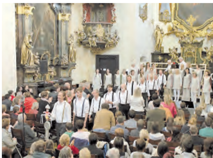
Přídavkem „Hoja hoj“ z Noci na Karlštejně se sboristé loučí s nadšenými diváky.