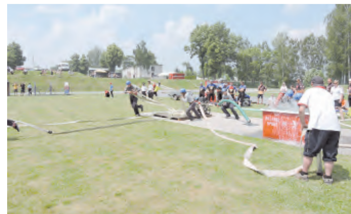
Požární útok mužů.