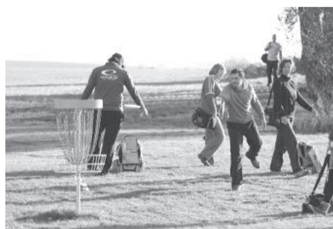
Foto z loňského turnaje.