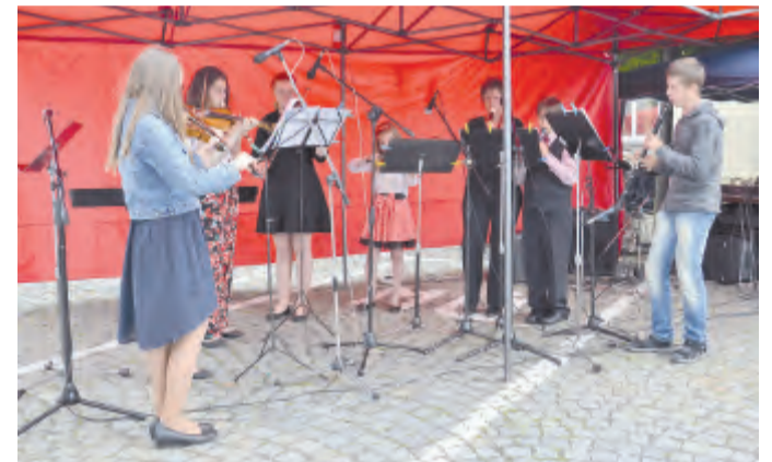
Komorní orchestr ZUŠ Světlá n. S.