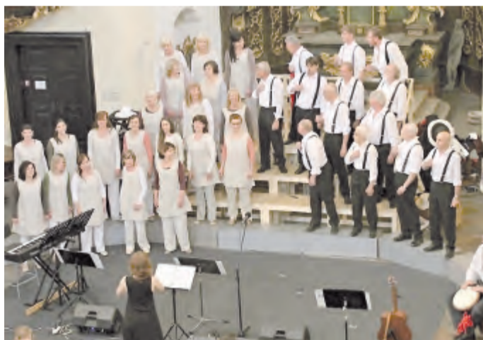
Mohutné ovace si vysloužila píseň z filmu Lví král.