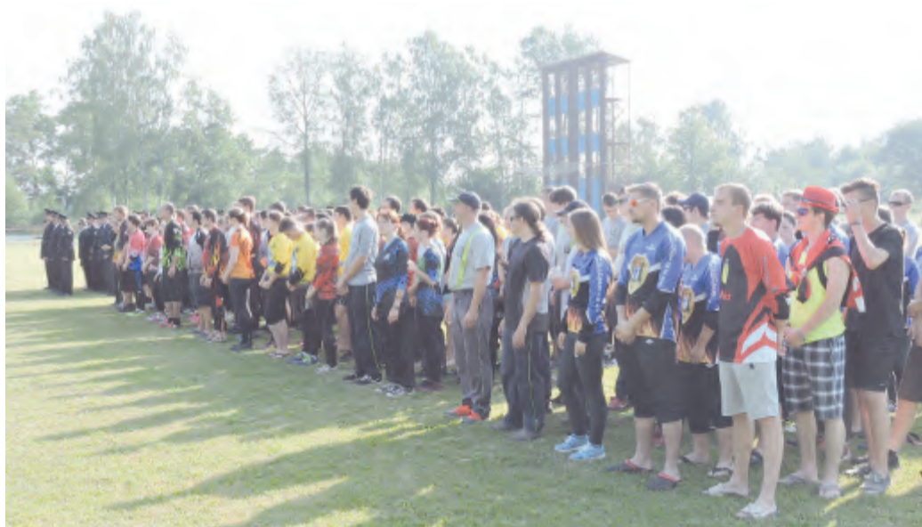
Slavnostní nástup soutěžících.

Havlíčkův Brod - Ve sportovním areálu Hasičského záchranného sboru (HZS) na Humpolecké ulici se v sobotu 25. června 2016 uskutečnila Okresní soutěž družstev sboru dobrovolných hasičů v požárním sportu. Pořadatelem akce bylo Okresní sdružení hasičů (OSH) Havlíčkův Brod. V sobotu ráno už bylo kolem sedmé hodiny