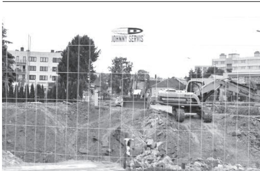
A je po mostě! Po měsíci příprav a překládce inženýrských sítí zmizel letitý most přes Zábinec u brodského hotelu Slunce. Během prázdnin místo něj vybudují stavbaři nový, lepší, širší ...