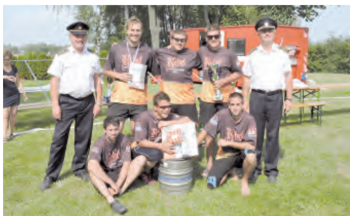
Muži SDH Česká Bělá zvítězili v požárním útoku.