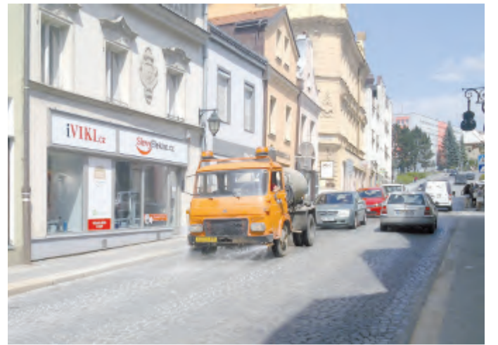
Při pohledu na kropící vůz Technických služeb Havlíčkův Brod v pátek 24. června 2016 v Horní ulici si mnoho lidí uvědomilo, že horké léto už konečně dorazilo.