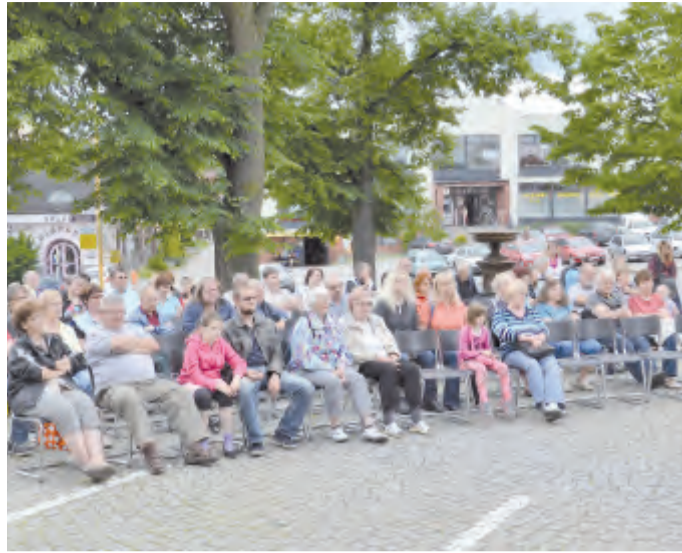
Posluchači na náměstí Trčků z Lípy.

Ve Světlé nad Sázavou se Svátek hudby konal už popatnácté. Celé odpoledne až do večera zněla na náměstí Trčků z Lípy hudba několika žánrů. Jako první vystoupil Taneční orchestr Základní umělecké školy Světlá n. S. následovaný smyčcovým komorním orchestrem ZUŠ (rovněž ze Světlé n. S.). Dalším účinkujícím byl soubor Coventina složený ze žáků světelské a humpolecké „zušky“, který se prezentoval irskými, skotskými a keltskými skladbami. Po něm vystoupil