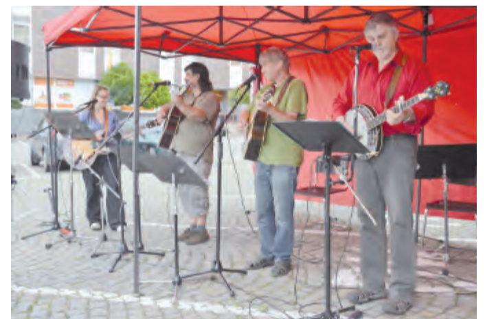
Country skupina Fernet.