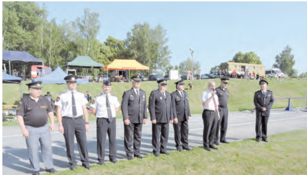
Pořadatelé akce a hosté pozdravili soutěžící.

Výsledky mužů: Štafeta 4 x 100 metrů s překážkami: 1. SDH Dobrá, 2. SDH Česká Bělá, 3. SDH Kojetín