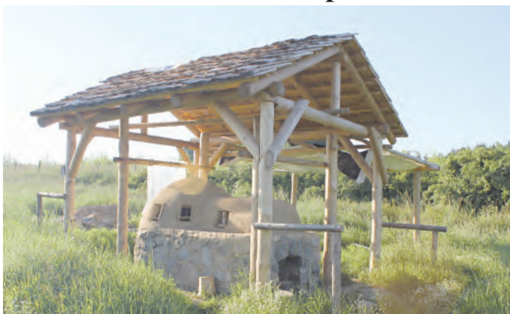
Zastřešená replika středověké sklářské pece.