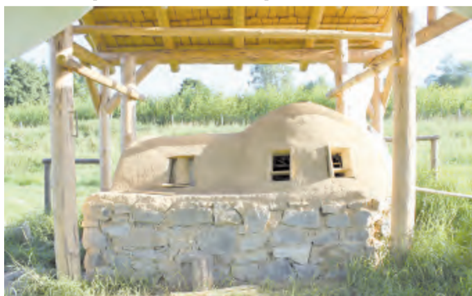
Vše je z místních zdrojů - kámen z kamenolomu v Pohledu, jíl z Kejžliče, dřevo z městských lesů.

Havlíčkův Brod – Replika středověké sklářské pece, která na jaře vyrostla na okraji Vlkovska, se měla začít koncem června začít roztápět. Její tvůrci z brodského muzea ale musí tento proces ještě o několik týdnů odložit. Musí totiž počkat, až vrchní vrstva z jílu dokonale vyschne, jinak by se jim mohla stavba rozpadnout.