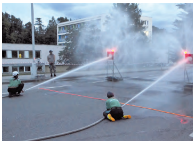
Děvčata ze Zdislavic.