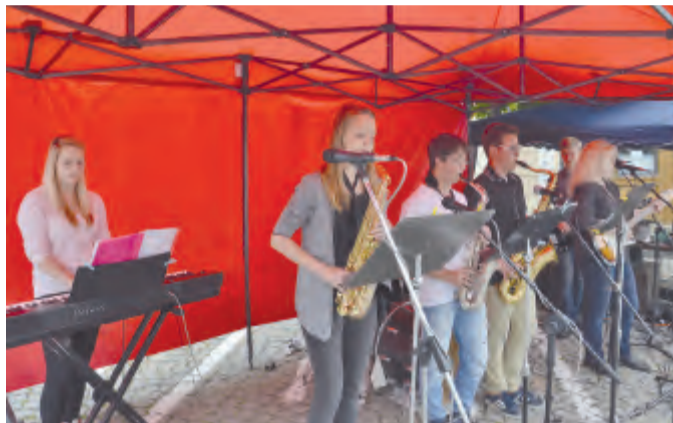
Taneční orchestr ZUŠ Světlá n. S.