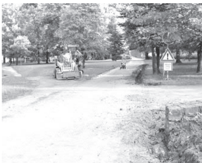
V havlíčkovobrodském parku Budoucnost nyní od „zimáku“ až k Chotěbořské ul. probíhají stavební úpravy a popojíždějí malé pracovní stroje - to se hlavní cesta upravuje tak, aby vyhovovala i jako cyklostezka. (Text a foto: mal)