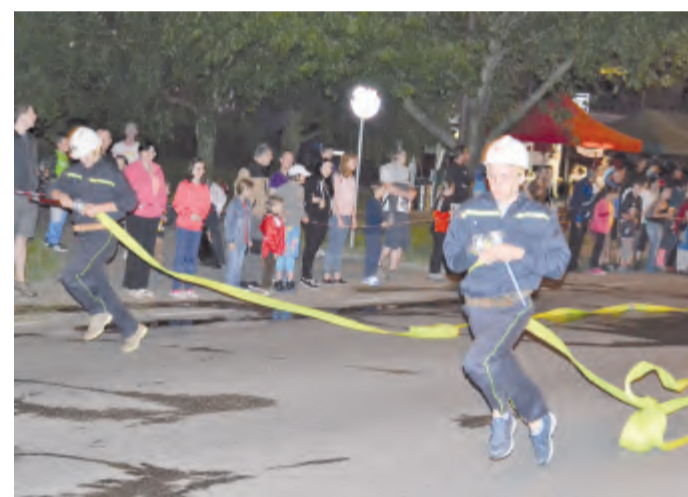
Krátce po startu.