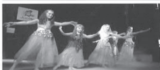
.. Ne stádění se všichni zří!

vznikla akademie. První akademie se konala v roce 2007 ve sportovní hale. Součástí byl i den otevřených dveří Junioru. Akce byla velmi úspěšná. Od té doby se pořádá každé dva roky v sokolovně. Více než dvouhodinový maraton vystoupení je doplněn výstavou prací dětí i dospělých a fotografiemi z činnosti. V roce 2016 proběhla jedna akademie navíc kvůli oslavám 60 let Junioru. Vystoupení bylo možno sledovat na internetových stránkách, na adrese www.vysilamezive.cz . Návštěvníci zde také měli možnost ochutnat občerstvení zhotovené kroužkem Mlsná vařečka. Junior i vystupující jsou vždy potěšeni přítomností starostů a dalších zástupců města, ředitelů škol a významných hostů. Vystoupení svědčí nejen o šikovnosti dětí, ale zejména o schopnostech vedoucích zájmových útvarů a vysoké úrovni zájmového vzdělávání v Junioru.