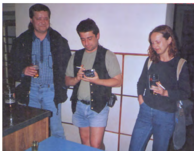
Bylo plno i ve výčepu