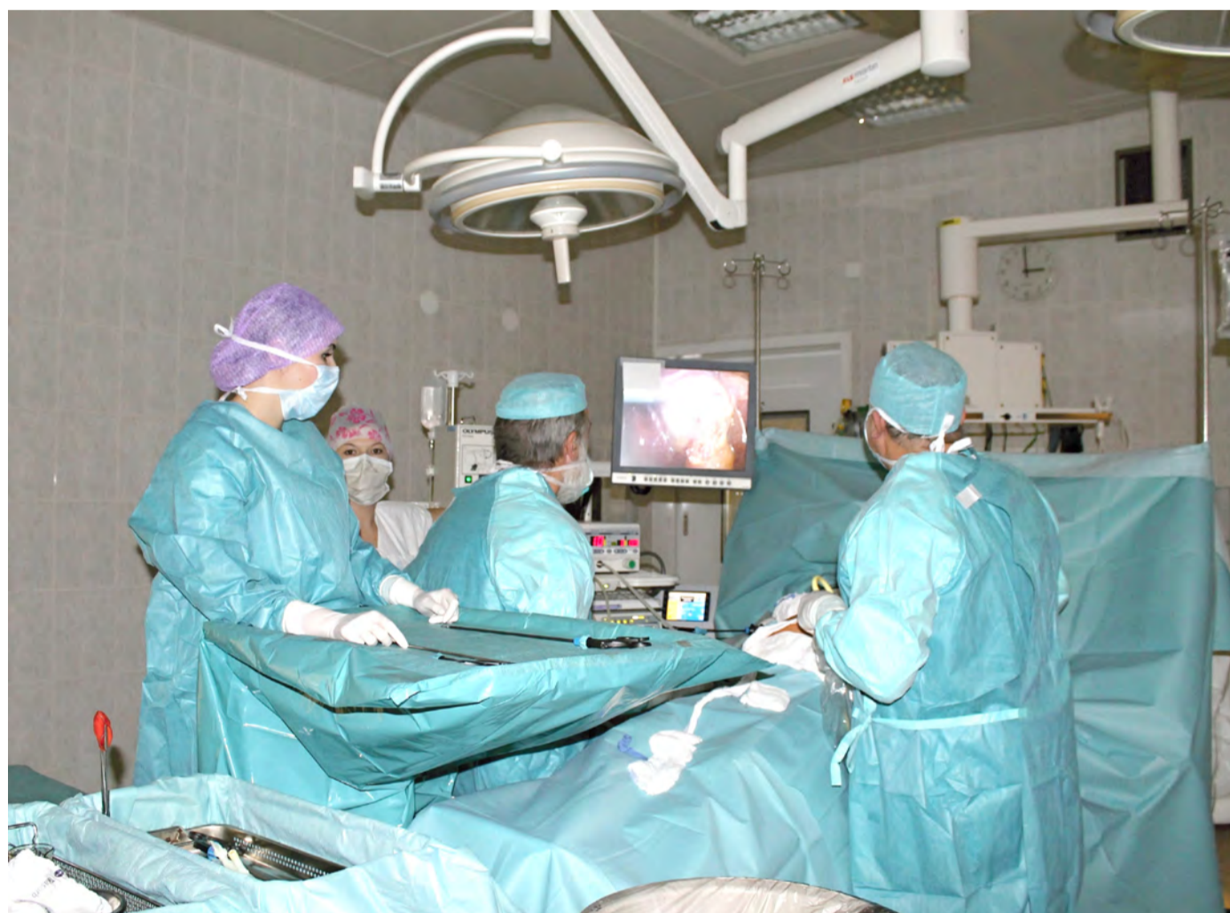
Obraz břišní dutiny zprostředkovaný kamerou vidí operátoři na obrazovce a nástroje ovládá zvenčí přes dlouhé držáky.

Více informací a fotografie naleznete na stranách 7 a 10.