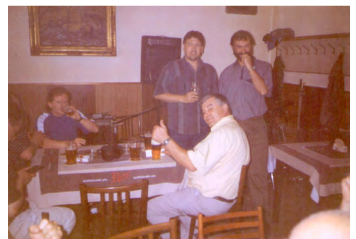
Zástupci Českého telecomu