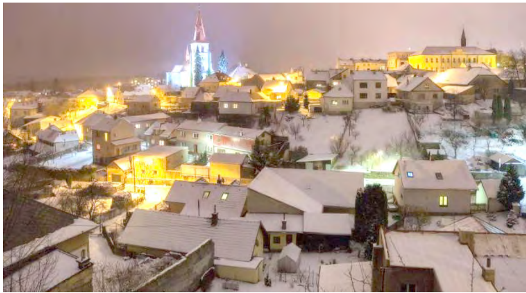
Zimní panorama Chotěboře.