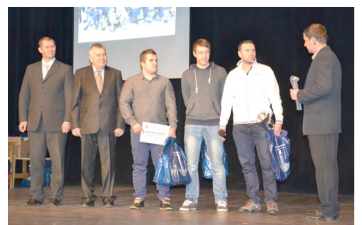
Hokejisté HC Světlá n. S.