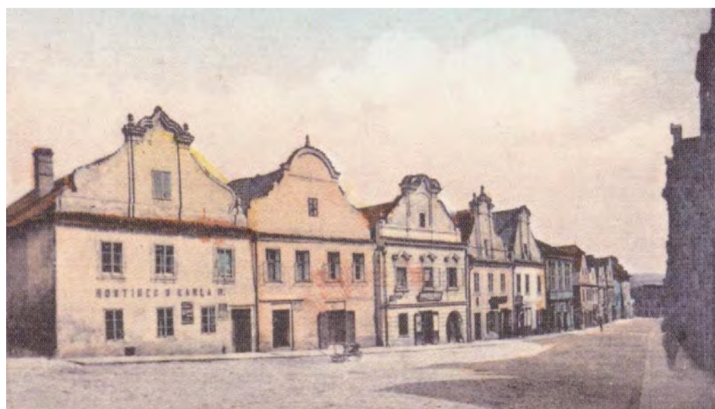
Pohlednice z roku 1908