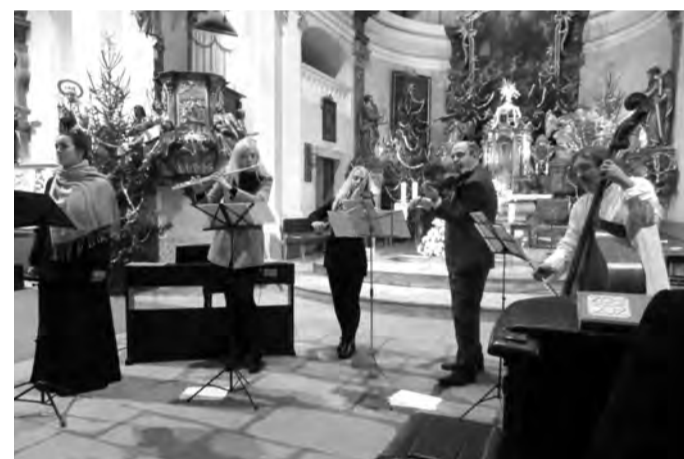
Tříkrálový koncert Příbyslav