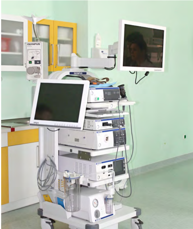
Nová endoskopická laparoskopická sestava je moderně vybavená, kromě speciálních přístrojů obsahuje například i kompletní videořetězec ve FullHD rozlišení a plochý LCD monitor.