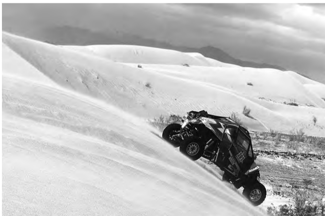
Buggy Arctic cat zachycená v etapě Rallye Dakar 2016

Osmatřicetý ročník Rallye Dakar se uskutečnil od 2. do 16. ledna 2016 v Argentině a Bolívii. V Jižní Americe se jela Rallye Dakar po sedmé. Do závodu se zapojilo 354 závodních strojů, na jejichž posádky čekalo více než 9000 km. Česká účast na Rallye Dakar 2016 byla netradičně vysoká počtem účastníků.