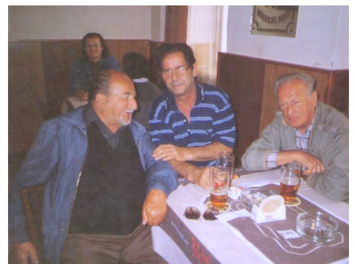
Štamgasté vzpomínají na staré časy