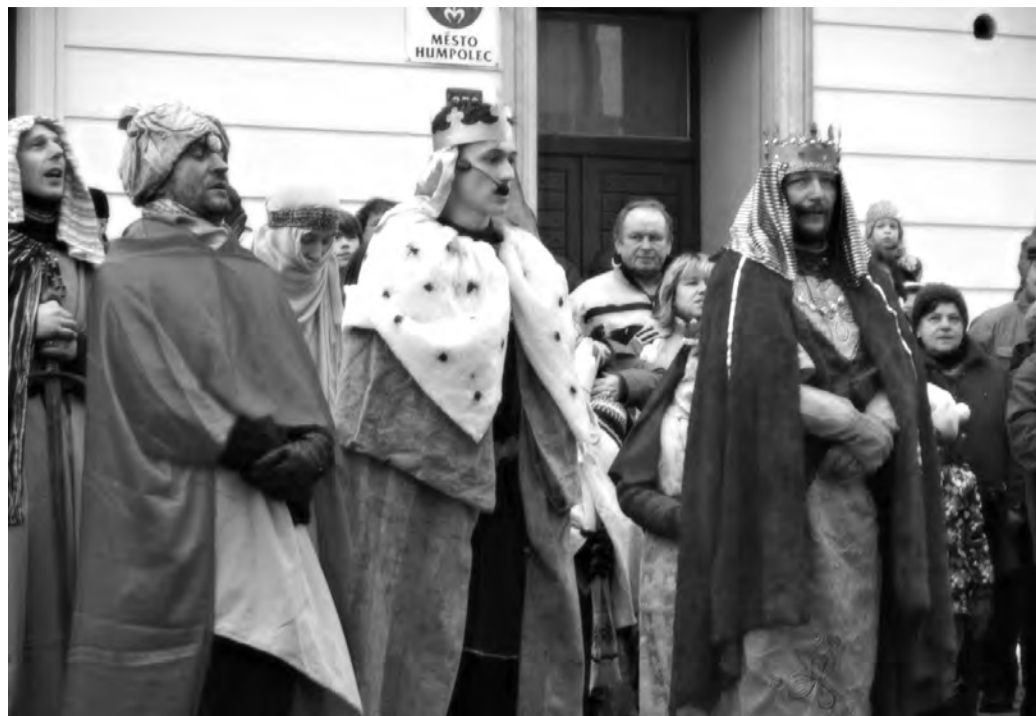
Tři králové přicházejí

Havlíčkův Brod – Tříkrálovou sbírku 2016 doplnila čtveřice kulturních akcí – Tři králové přicházejí, dva Tříkrálové koncerty a dále hra Čtvrtý z mudrců.