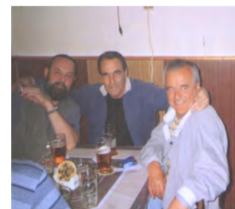
Nerozluční přátelé už od dětství

štamgastů od Karla IV. k 15. výročí ukončení provozu.