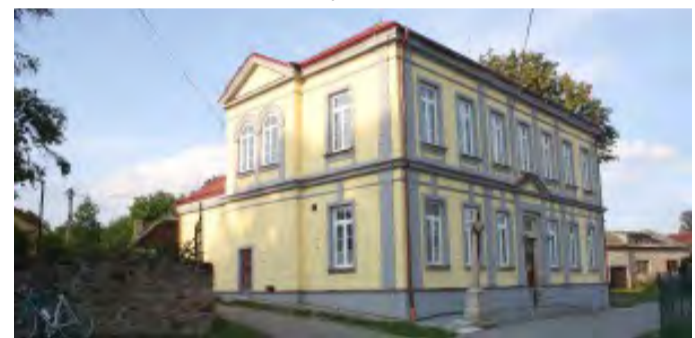
Budova nově rekonstruované školy v Sázavce