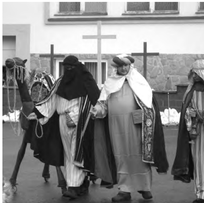
Čtvrtý u mudrců (ilustrační foto)