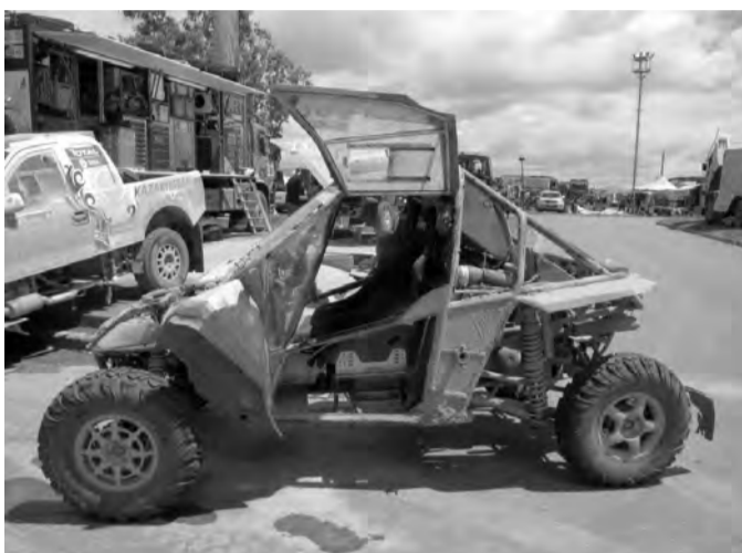
Nepojízdná buggy a konec v soutěži