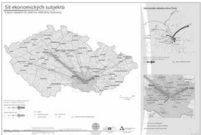
Sít ekonomických subjektů navázaných na EDU