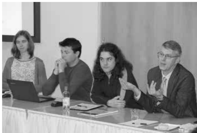
Část řešitelského týmu Univerzity Karlovy v Praze