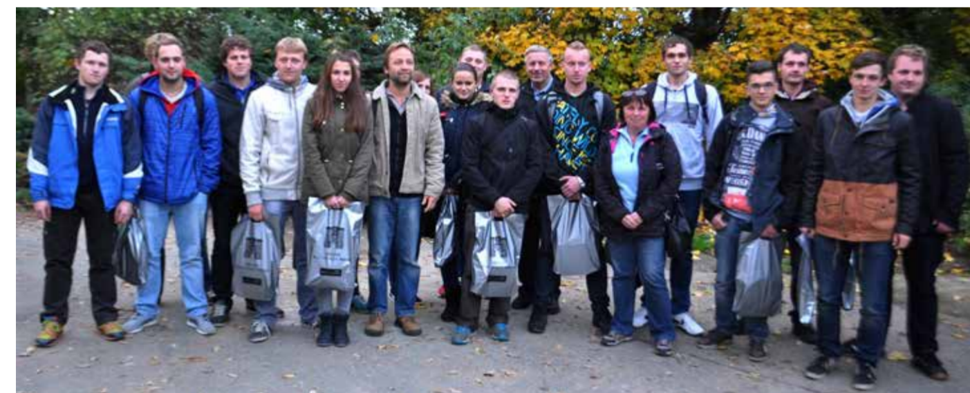
všichni soutěžící s doprovodem po ukončení soutěže