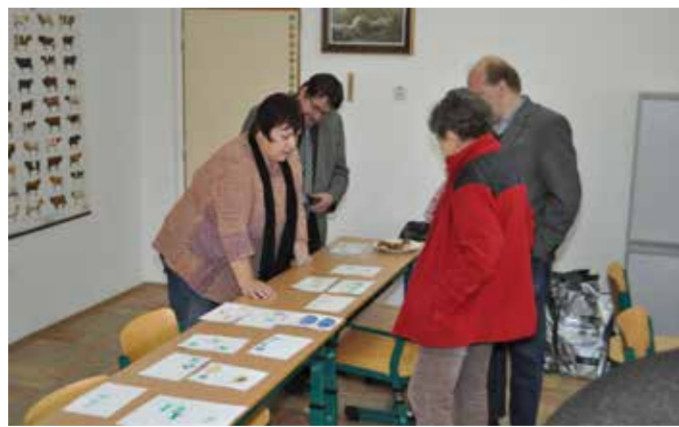
Koupím, Prodám, Zaměstnání, Ostatní