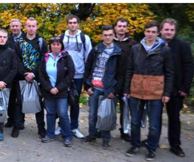
komise vybírá nejlepší bramborové razítko