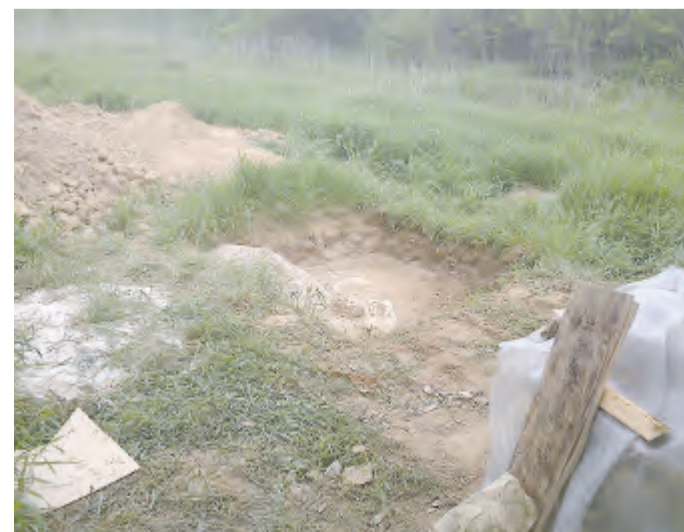
Díra v poli slouží k míchání jílovité malty.