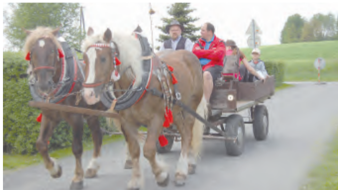
Doprovodný program povoz s koňmi.