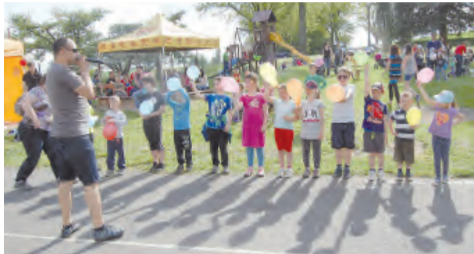
Děti plnily úkol.