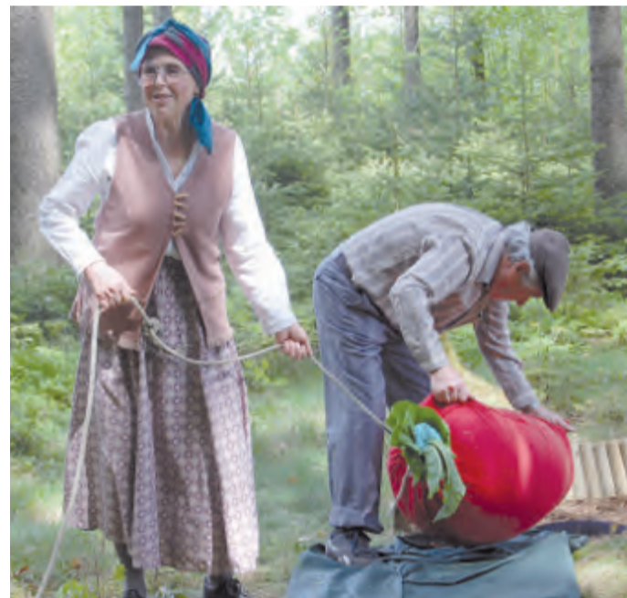
Dědeček a babička tahali velikou řepu.