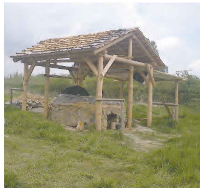
Ve Vlkovsku na poli se staví replika středověké sklářské pece.