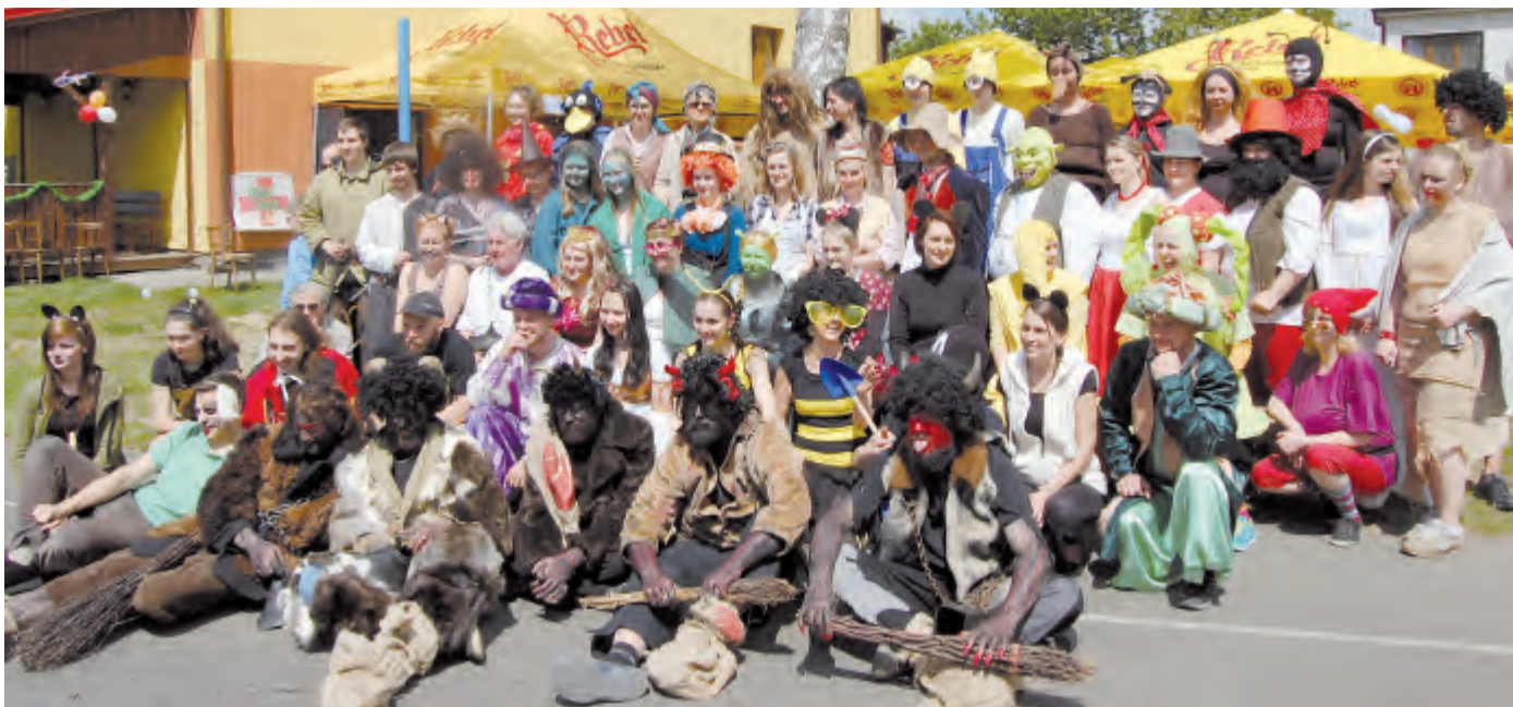
Společné foto pohádkových bytostí.