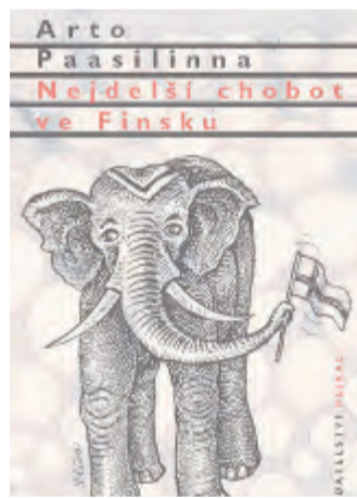
Obálka knihy Nejdelsí chobot ve Finsku.