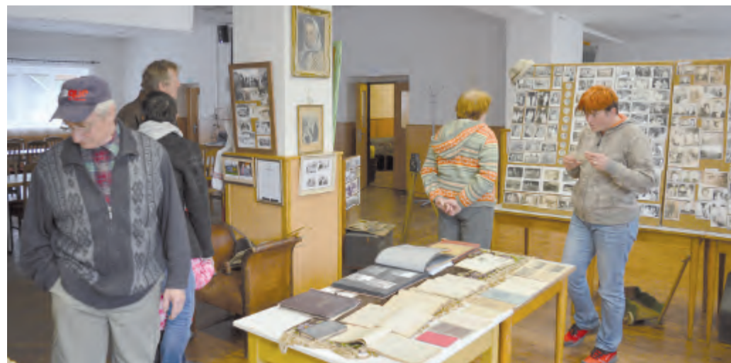
Výstava sklídila úspěch u návštěvníků.