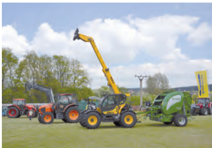
V areálu školy.