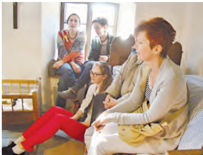
Pohodově naladěné a pečlivě naslouchající publikum.