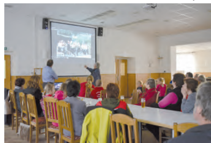
Promítání fotografií ze srazu rodáků obce Vepříkov v roce 1971.