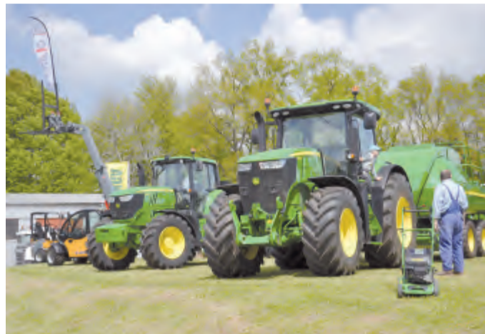
Výstava zemědělské techniky.