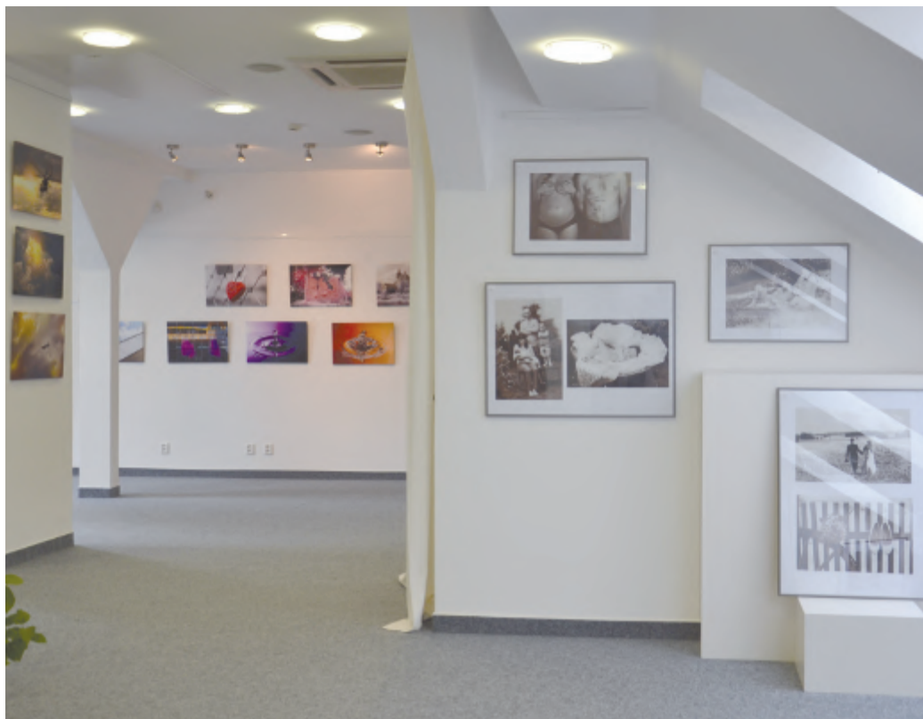
Výstava v Galerii Na Půdě.

Pod názvem Letem světem s Fotoklubem představují členové Fotoklubu Světlá nad Sázavou svoje snímky tentokrát nikoli ve vestibulu Sportovního centra Pěšinky, jak tomu již několikrát bylo v minulosti, ale v Galerii Na Půdě. Část fotografií je v černobílém provedení, což bylo přání většiny respondentů anket probíhající v minulém roce na facebooku.