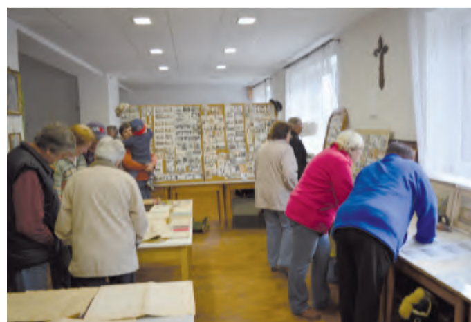
Na fotkách se našli pamětníci.