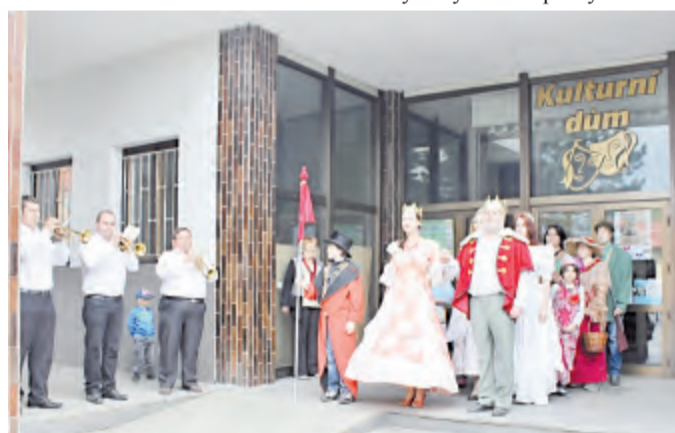
Fanfáry a královská družina zvou diváky na pohádku.

Nedělní odpoledne patřilo další tradici - průvodu pohádkových