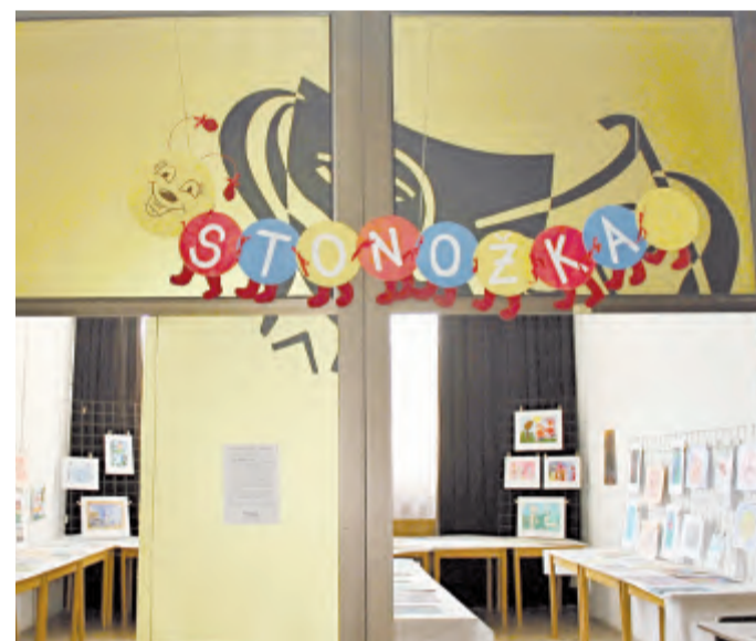
Výstava pro Stonožku opět zájemcům nabídla výběr originálních dětských prací.