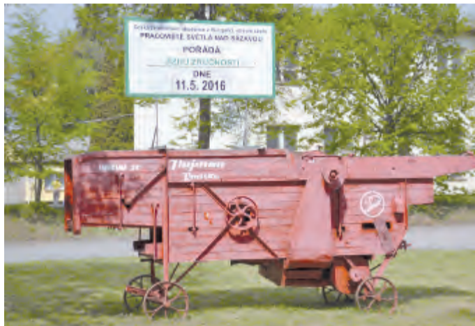
Poutač před areálem.