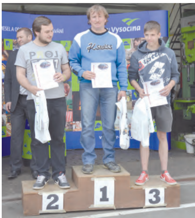
Vítězné soutěže v ovládání hydraulického nakladače.