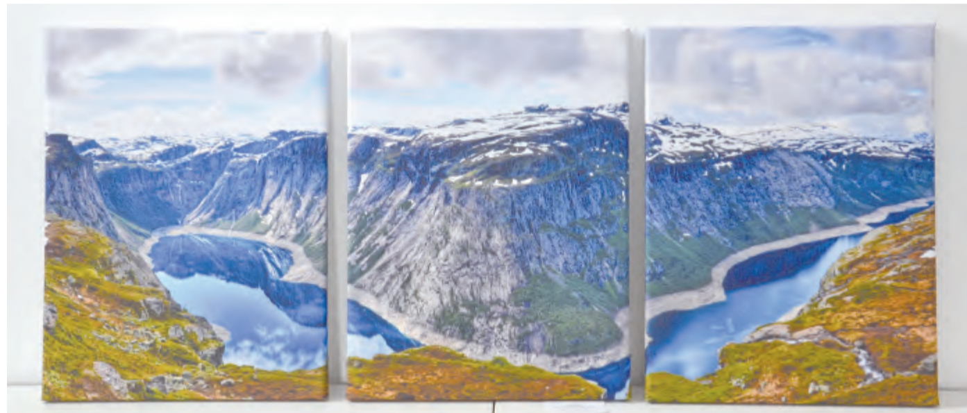
Snímek Jakuba Čapka z Norska.