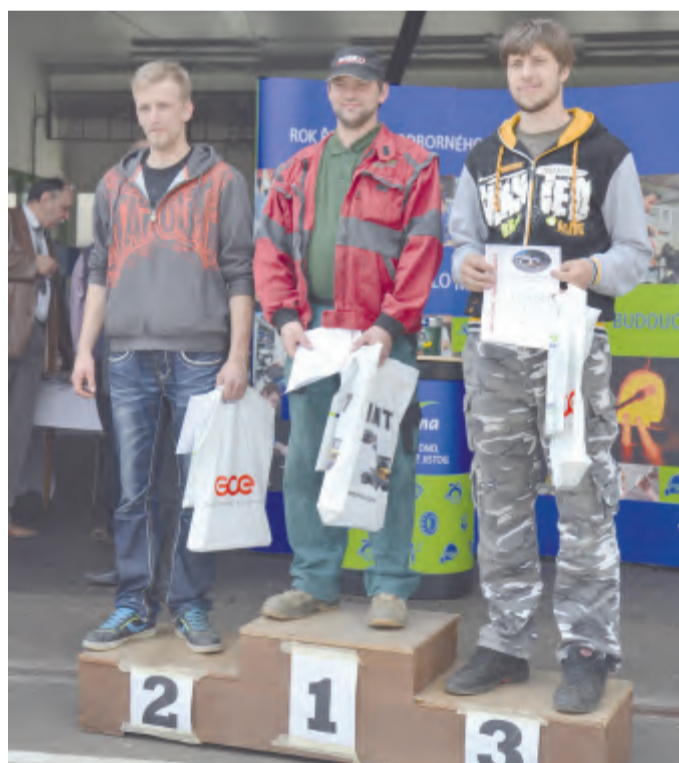
Vítězné soutěže v couvání s vlekem.