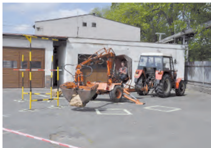
Soutěž v ovládání hydraulického nakladače.