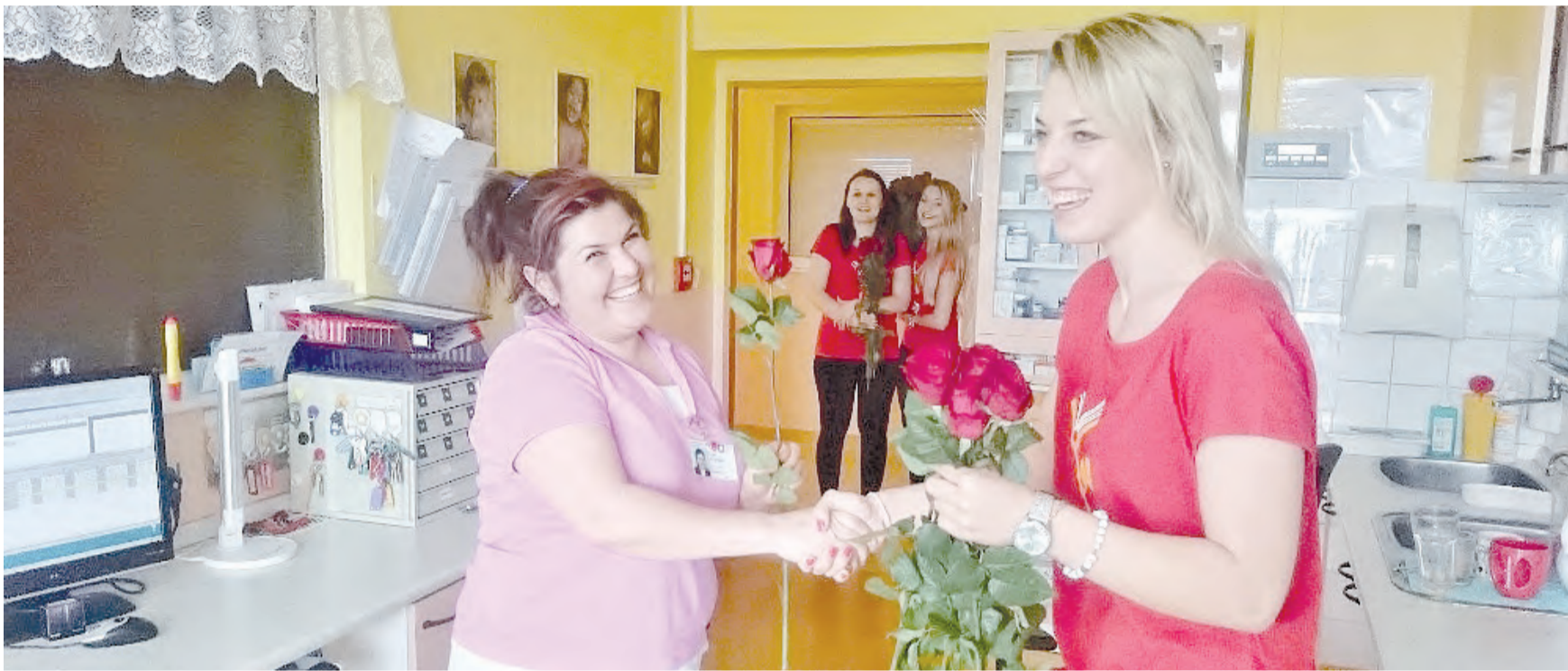
Mezinárodní den sester se ve čtvrtek 12. května slavil i v havlíčkovobrodské nemocnici. Všechny sestřičky dostaly od studentek Vysoké školy polytechnické v Jihlavě, které tam vykonávají praxi, krásnou růži. Květina udělala radost a vykouzlila úsměvy na tvářích. Aktuálně v nemocnici pracuje 444 zdravotních sester a 38 porodních asistentek. (pče)