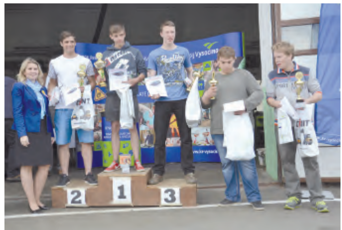
Stupně vítězů jízdy zručnosti.

Velikost jedné fotografie může být maximálně 2 MB. Děkujeme a těšíme se na Vaše příspěvky.