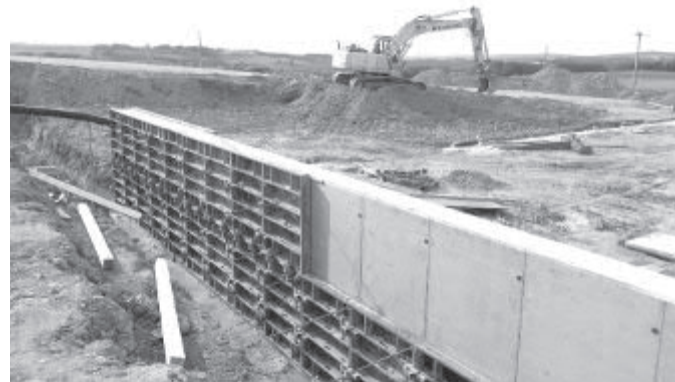
Místo Selské jizby bude nový obchod se sportovním a lyžařským vybavením.

Vzhledem k velkým investicím na připojení inženýrských sítí jsme uvítali vloni v létě mož-