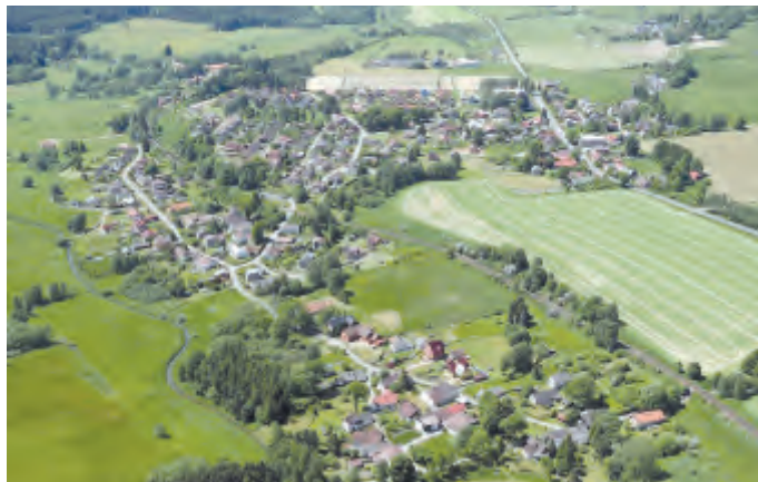
Sobiňov leží v údolí Doubravy v místech, kudy už v r. 1144 vedla k Libčické obchodní stezka.

Obec Sobiňov spolu s místními částmi Sopoty, Nová Ves (Huť), Hlína, Markvartice a Zvolanov leží v náhorní rovině nad řekou Doubravou v nadmořské výšce 550 m. Severní horizont tvoří hřeben Železných hor, východní Žďárské vrchy, na jih se rozkládá masiv Ranského Babylonu a pásmo Sopotských lesů. Na západ je otevřená kotlina směrem k Bilku. Obec má 702 obyvatel (k 31. 12. 2015) a je vzdálena přibližně 7 km východně od Chotěboře.