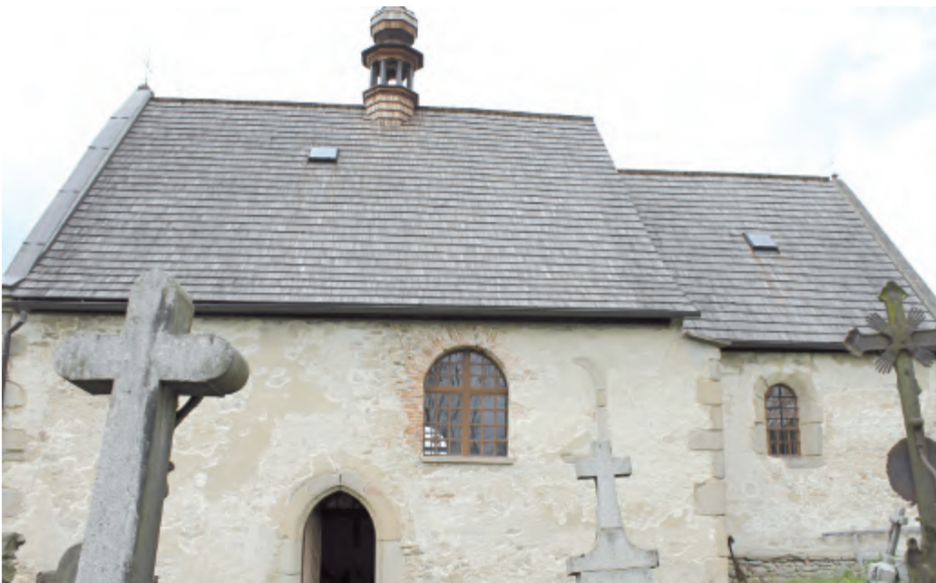
Sv. Martin – Dolní Město.

Lipnice n. S. – Přátelé podlipnických kostelů, o.p.s. a farnost Lipnice nad Sázavou připravili na sobotu 23. dubna další akci k propagaci tří polozapomenutých církevních památek. Středověké kostely sv. Jiří v Řečici, sv. Martina v Dolním Městě a sv. Markéty v Loukově byly opět po půl roce otevřeny pro veřejnost. Pro zájemce proběhly i komentované prohlídky, které doplnila duchovní hudba.