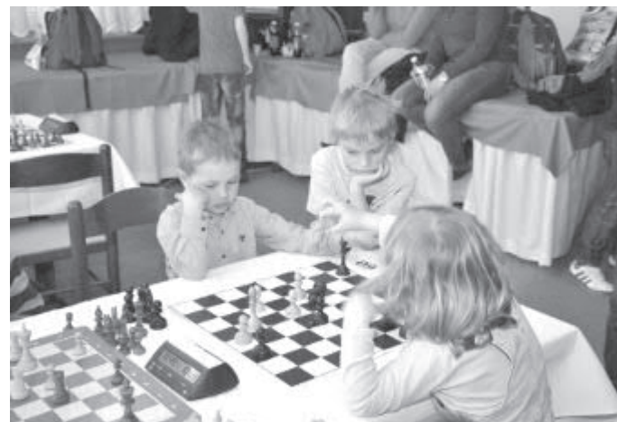
Pohled na hru nejmladších.