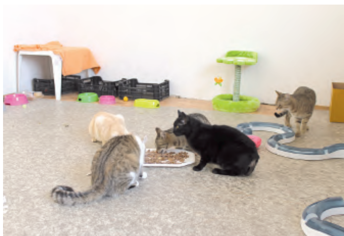
Čisté a slunečné místnosti v útulku.

čátkem ledna dozvěděli o uvolnění prostor v malém domku na Ledečské a neváhali ani minutu. Současné prostory jsou pro provoz kočičího útulku nesrovnatelně vhodnější, a to ze všech hledisek. Rozhodly zejména nižší provozní náklady, ale velkou výhodou je i vnitřní uspořádání, protože teď jsou k dispozici dvě oddělená patra. Je tedy jednoduché odlišit prostory, kde budou pobývat zdravé kočky a kam bude moci veřejnost, od místností pro karanténu, kterou nyní budují tak, aby odpovídala veškerým potřebám