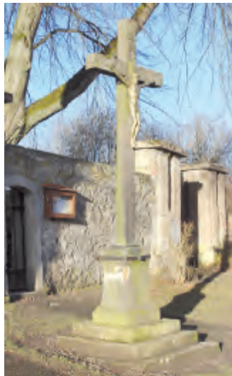
Piskovcový kříž v Sopotech, který by měl spolu s kostelem a dalšími křížky v obci projít opravou.

V údolí řeky Doubravy je přírodní rezervace Niva Doubravy o rozloze 86 ha, která byla vyhlášena v roce 1994. Jedná se o významný komplex přirozených