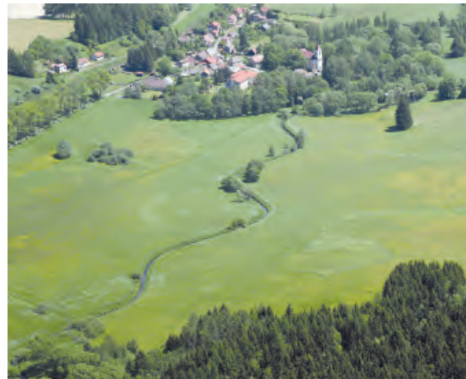
Místo pro budoucí rybník, který vznikne při revitalizaci toku Doubravy.

stupitelstva obce Sobiňov pozvat všechny občany na středu 4. května v 19 hodin k hrobům padlých, kde si krátkou vzpomínkou připomeneme padlé sobiňovské občany v květnu 1945.