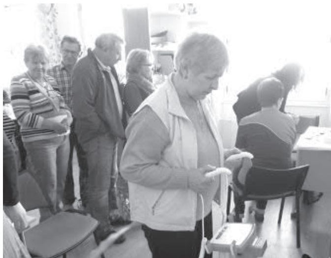
Velký zájem byl o měření tlaku, cukru a cholesterolu.