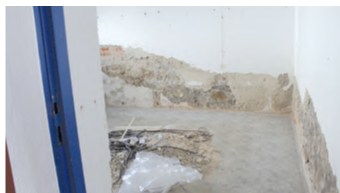
Prostory pro budoucí karanténu ještě vyžadují hodně práce.