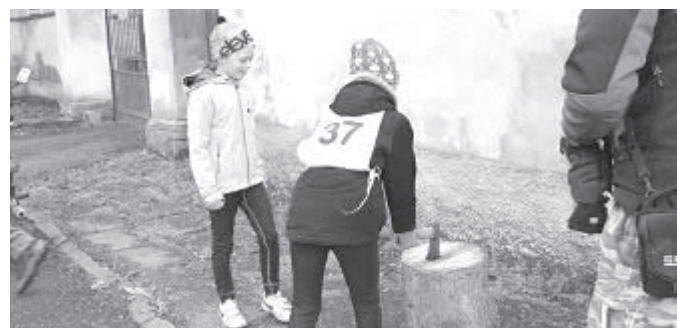
Jednou z těžších disciplín bylo zaseknout sekeru doprostřed špaluku.

Maleč – Reg. centrum Sport pro všechny (SPV) Havlíčkův Brod připravil pro své cvičence všech žákovských kategorií krajské kolo soutěže s názvem Medvědí stezka. Pořadatelky se úkolu tentokrát premiérově zhostili cvičitelé TJ Maleč, kteří v terénu za fotbalovým hřištěm a přilehlých uličkách obce vytýčili zhruba čtyřkilometrovou trať s deseti stanovisky. Na těch plnily dvoučlenné hlídky rozmanité úkoly, při nichž