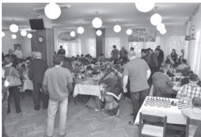
Pohled do sálu turnaje v hotelu Slunce.