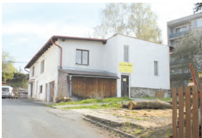
Nové sídlo kočičího útulku na Ledečské ul.

Havlíčkův Brod – To je dobrá zpráva pro všechny příznivce a přátele kočičího útulku: od poloviny dubna najdete kočičky na nové adrese - Ledečská 2136. Je to na výhledu na Světlu n. S., téměř na konci hlavní městské zástavby, ale přitom jen cca 10 minut od centra.