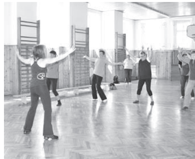
Ukázka cvičební hodiny Zumba Gold (pro seniory).

Jak potvrdila Ilona Loužeková, ředitelka Oblastního spolku ČČK, který brodský Senior Point za-