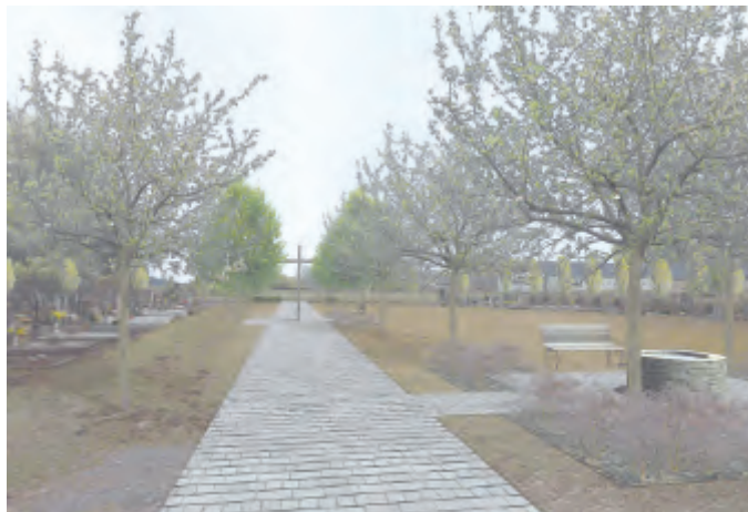
Ukázka ze studie revitalizace hřbitova a okolí.

To ještě ne, ale chceme mít právě všechno připraveno tak, abychom mohli o některé dotace požádat. Akci máme proto rozdělenou do tří etap, takže např. chceme oddělit samotnou zeleň od staveb-