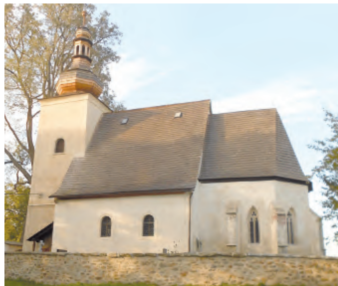
Sv. Markéta – Loukov.

Řečice. A do společné kasičky pokračují i návštěvníci kostelíků, které jsou vždy všechny tři