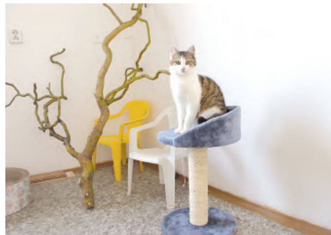
Časem přibudou v místnostech další doplňky a dekorace.