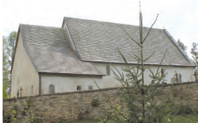
Sv. Jiří – Řečice.

Společnost od počátku své činnosti pomáhá získávat finance, potřebné na opravu kostelů. Ty pak postupně investuje do nezbytných oprav. Kostely patří do lipnické farnosti, která tuto iniciativu vítá a podle svých možností také pomáhá. Např. v Řečici už byl opraven nejen kostel, kde došlo k položení nové střechy, ale i venkovní omítka a ohradní zdi hřbitova. Na opravách se finančně podílí i obec