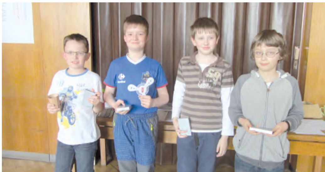
Družstvo ze ZŠ Kruceburk skončilo na krásném 3. místě.