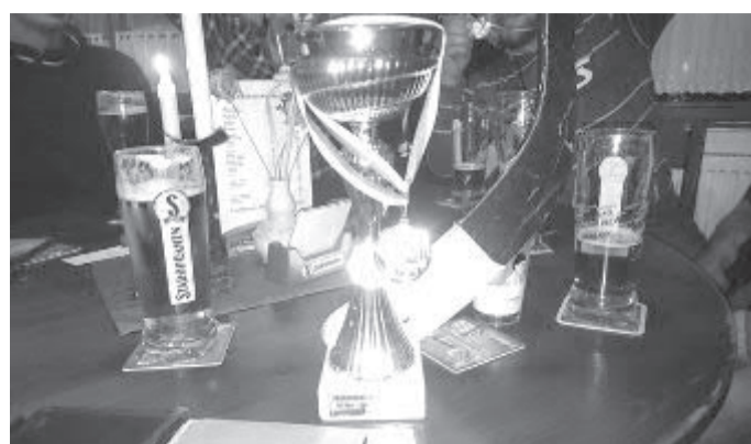
V právě ukončeném ročníku 2015-2016 Posázavské hokejové hobby ligy získali hokejisté "HC VILÉMOVICE" první místo třetí ligy této soutěže. Za podporu děkují všem sponzorům a fanouškům.