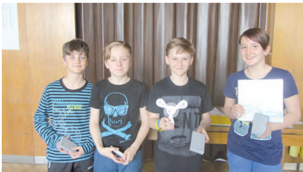
Do okresního kola postupují i „stříbrní“ ze ZŠ Maleč.

Ve středu 13. dubna se v chotěbořském Junioru DDM-SVČ setkali žáci pátých tříd základních škol z Habrů, Ždírc nad Doubravou, Havlíčkovy Borové, Rozsochatce, Nové Vsi, Kruceburku, Libice nad Doubravou, Sobiňova, Uhelne Příbrami, Vilémova, Malče a místních ZŠ Buttulova a ZŠ Smetanova. V okrskovém kole znalostí a dovedností Všeználek, kam postupovala nejlepší družstva školských