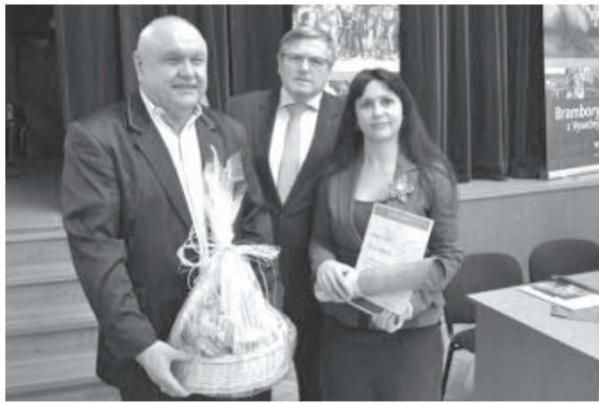
Pokračování ze strany 1

Havlíčkův Brod – V pondělí 11. dubna Kraj Vysočina už podruhé ocenil nejaktivnější Turistická informační centra, působící na jeho území. V roce 2015 zahrnují novinkami návštěvníky měst nejvíce TIC v Příbyslavi, Chotěboři a v Třebíči. Z měst nad 10 tis. obyvatel si pomyslnou stříbrnou medaili odvezl Havlíčkův Brod. Soutěž opět vyhlásil krajský odbor kultury, památkové péče a cestovního ruchu spolu s krajskou pří-