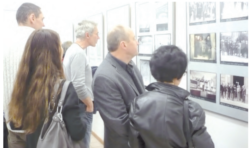
Návštěvníky výstavy zaujaly fotografie z historie Německého Brodu.