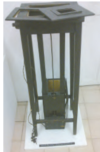
Vzácný fotoaparát OKAM vyrobený v Německém Brodě.

Fotografie Gustava Dvořáka z let 1890 až 1912 jsou důležitým materiálem pro poznání staré podoby