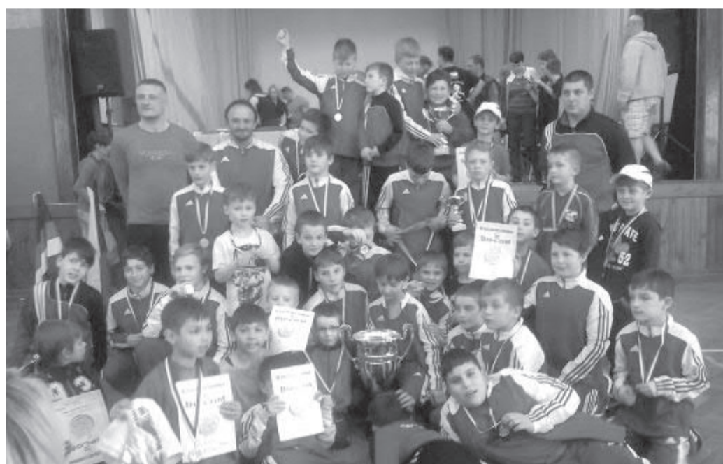
Borohrádek – celá broďská výprava.