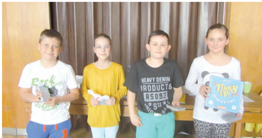
Prvenství v okrskovém kole Všeználka si odvezli kluci a děvčata z Libice nad Doubravou.