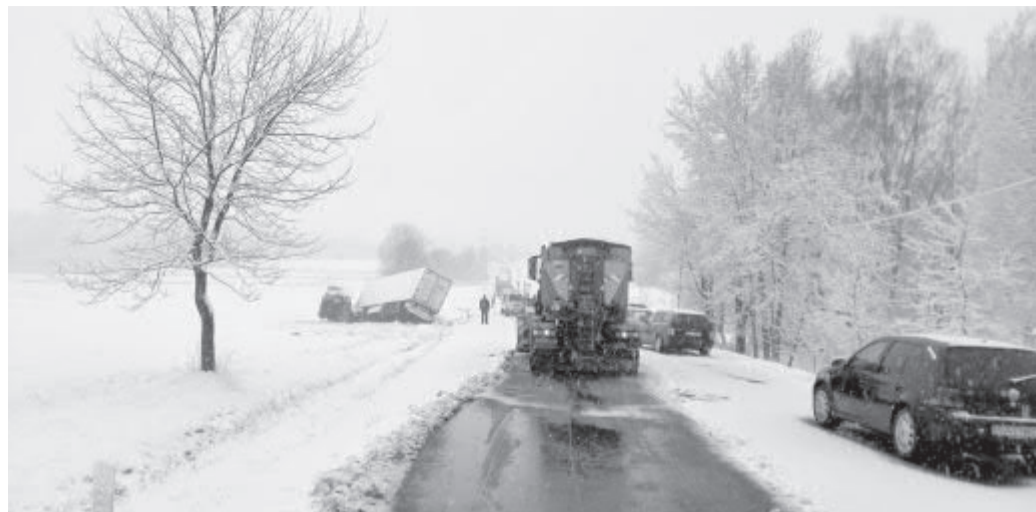
Zranění utrpěl také řidič kamionu.

přímém úseku silnice v klesání dostal na komunikaci pokryté čerstvě napadaným mokřím sněhem smyk a přitom vyjel vlevo do protisměrné části silnice, kde ve smyku narazil do přední části protijedoucího os. vozidla Ford Focus. Po střetu vozidel vyjela nákladní souprava vlevo mimo silnici do silničního příkopu a do pole, kde se zastavila. Osobní vozidlo skončilo mimo komunikaci v silničním příkopu.