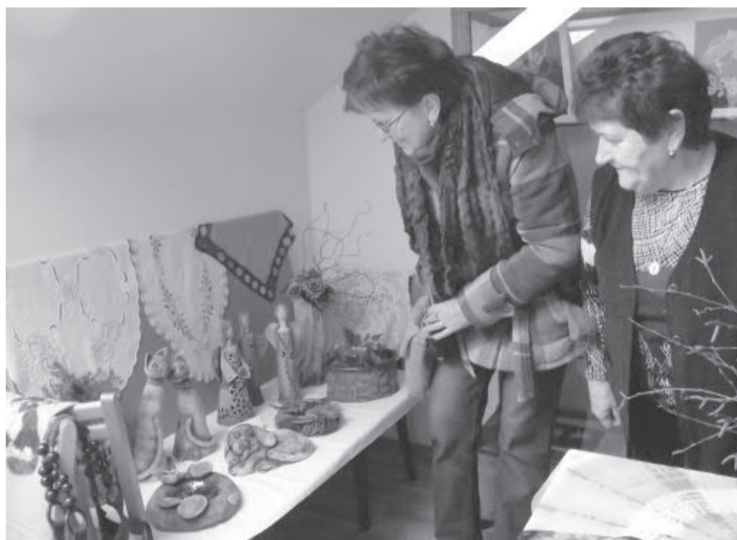
Sdružení klubu důchodců v Chotěboři pořádá pro své členy řadu zajímavých kulturních i vzdělávacích akcí. Jednou z nich je i tradiční výstava prací seniorů. Uskutečnila se v předposledním březnovém týdnu v podkrovních prostorách Knihovny Ignáta Herrmanna. O tom, že chotěbořští seniori nesedí doma se založenými rukama, svědčila celá řada nádherných výrobků z keramiky, košíčků z pedigu, háčkových a vyšívákových deček, šperků s polodrahokamy, květy orchidejí z rybích kostí nebo korálků a obrázků či oděvních doplňků z paličkováných krajky. Nechyběly ani drobné kovářské a jarní i velikonoční dekorace. Bylo opravdu na co koukat a v mnohém se i inspirovat. Jedinou chybou bylo, že výstava trvala jen tak krátce. (jz)

příklad uplést pomlázku, voskem ozdobit vajíčka, zhotovit košíčky na vajíčka nebo vyrobit jarní kytičky z netkané textilie. K dobré náladě přispěli členové divadélka DIK, kteří si s dětmi zazpívali jejich oblíbené lidové písničky.