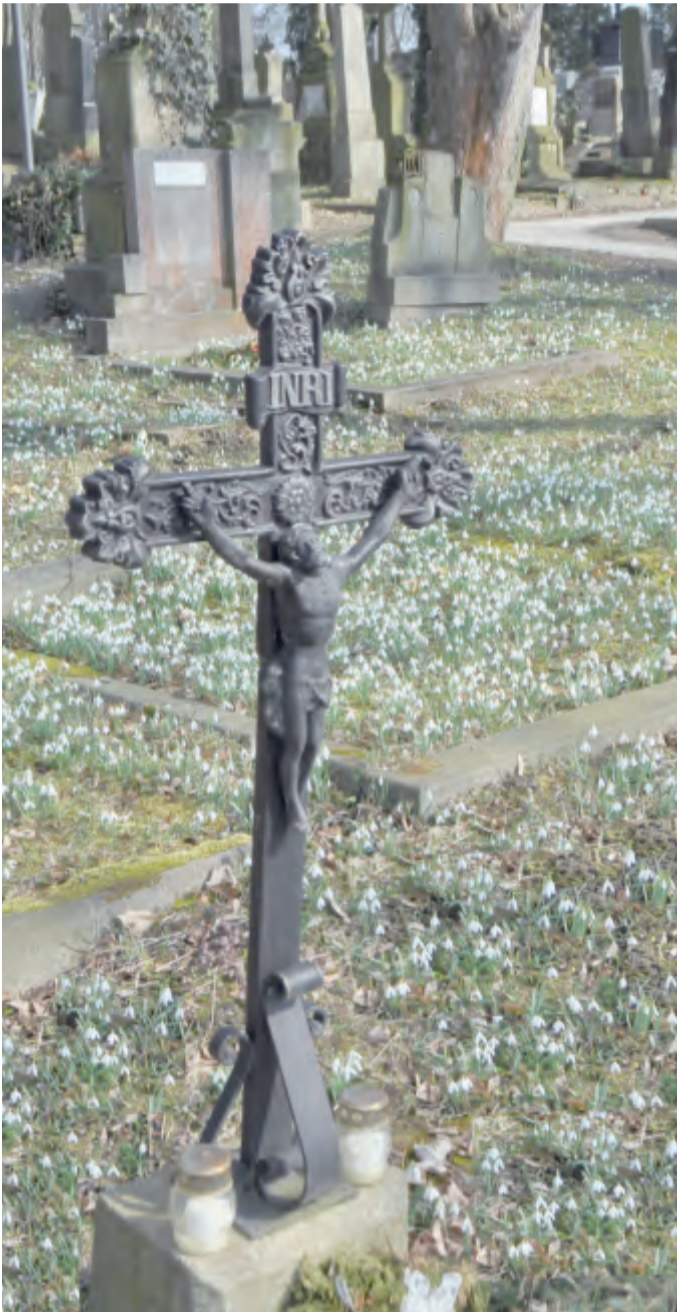
Sněženy - zvěstovatelé příchodu jara. Ostatně patří mezi nejnámější jarní rostliny. Jejich vegetaci prospívá klid a humózní, vlhká půda. Daří se jim pod keři či stromky, na zahradách stejně jako v parcích a v Havlíčkově Brodě i na hřbitově sv. Vojtěcha. Kostel sv. Vojtěcha z XIII. stol. je uváděn jako nejstarší ve městě. Samotný hřbitov je poprvé zmiňován na konci století XVI. Od roku 1783 až do r. 1961 byl hlavním městským pohřebištem. Dnes je vyhledávaným místem klidu a vyhovuje jak rozjímajícím návštěvníkům, tak i hojně kolonii sněženek bílých. JKt