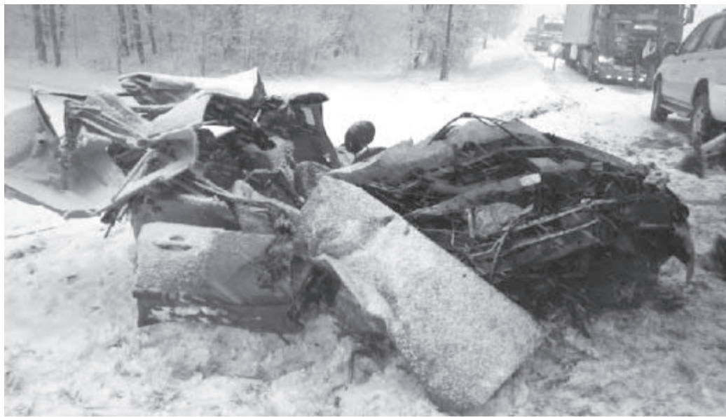
Havarovaného osobního vozidla museli hasiči zaklíněnou zraněnou řidičku vyprostit za použití speciálního hydraulického zařízení. Ihned po vyproštění byla zraněná žena předána do péče zdravotníkům.

Úterní střet kamionu a osobního vozidla krátce před šestou hodinou ranní, mezi Havlíčkovým Brodem a Jihlavou, zkomplikoval na celý den dopravu.