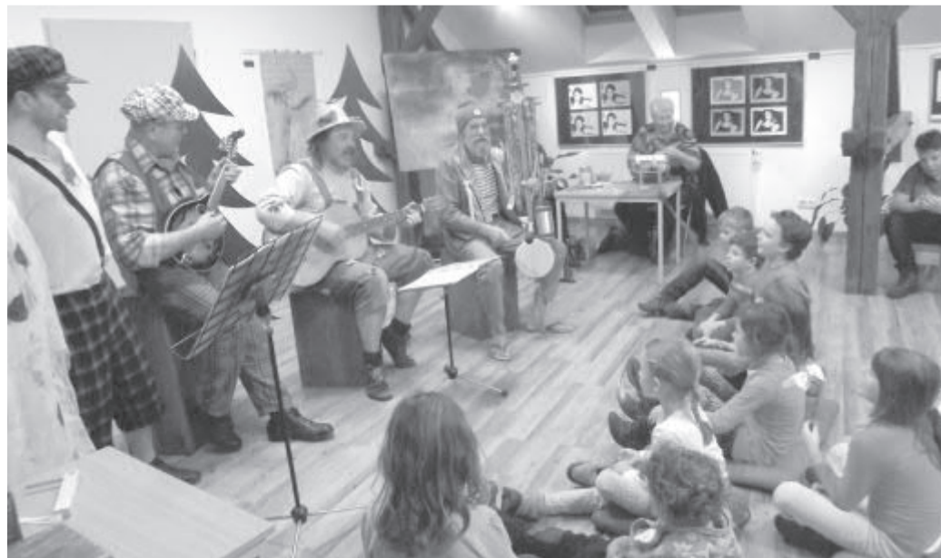
K dobré náladě přispěli také členové divadélka DIK