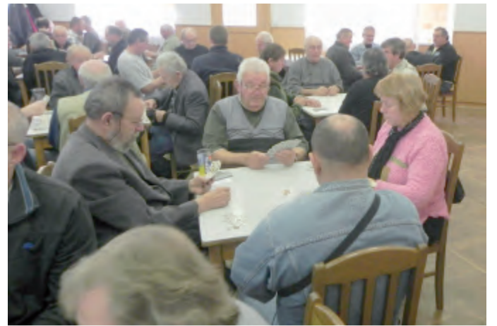
Sbor dobrovolných hasičů Vepřikov pořádá v místním hostinci v sobotu 26. března Turnaj v mariáši 17. ročník jarní kolo. Prezence od 8 hodin, začátek v 9 hodin, startovné 250 Kč, po celý den zdarma prdeláčka, k obědu gulášek a každý dostane většinou zabijačkovou cenu. Jab

Ročník 2. • Číslo 12 • ÚTERÝ 22. 3. 2016 • Cena 20 Kč • Předplatné 12 Kč