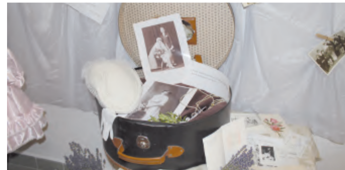
Výstava, na kterou svými rodinnými fotkami a předměty přispěly i návštěvnické Zvonečku, bude pro velký úspěch prodloužena až do pátku 24.2.