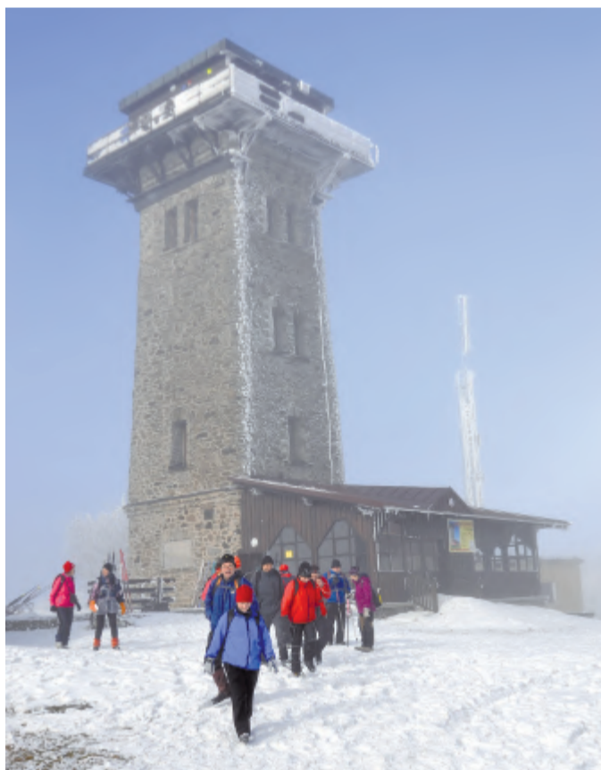
Kamenná rozhledna Kurzova věž na Čerchově, nejvyšším vrcholu Českého lesa.

Vždy jednou za dva roky pořádá KČT Český zimní sraz turistů. V roce 2015 pověřila sekce lyžařské turistiky ústředí KČT jeho uskutečněním Klub českých turistů, odbor Telč (tehdy mimochodem tři cvičitelé turistiky ze Světlé nad Sázavou vypomáhali jako pořadatelé), letošního pořadatelství se se ctí zhostil Klub českých turistů, odbor Domažlice.