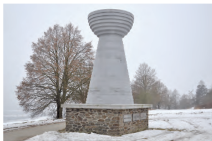
Pomník na Baldovském návrší.

Program srazu byl nadmíru bohatý, kromě lyžařských tras na strojově upravených tratích kolem Čerchova (1045 m) a několika pěších tras turisté absolvovali komentované prohlídky města, návštěvy Muzea Chodska a Muzea Jindřicha Jindřicha, vystoupení Domažlické dudácké muziky, koncert pěveckého sboru Čerchovan v arciděkanství