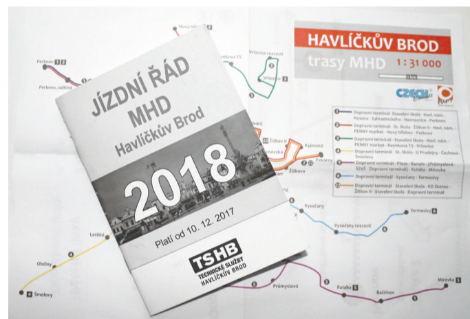
Sešitky s jízdním řádem, vydaným v prosinci, si mohou cestující zdarma vyměnit za nový

vy časové polohy a jízdní doby některých spojů s ohledem na zpoždění vlivem dopravní situace ve městě. Tam, kde to bylo možné, některé spoje z vedlejších linek 4, 5, 6 návazně pokračují bez nutnosti přestupu z dopravního terminálu hlavními linkami dále do centra. Byla provedena i celá řada dalších úprav, které jsou uvedeny v nově upravených jízdních řádech. Ty jsou už nyní dostupné na stránkách: www.tshb.cz v sekci „MĚSTSKÁ DOPRAVA“ a budou také zveřejněny v Havlíčkobrodských listech č. 3., které by měly být dodány do všech domácností v prvních březnových dnech.