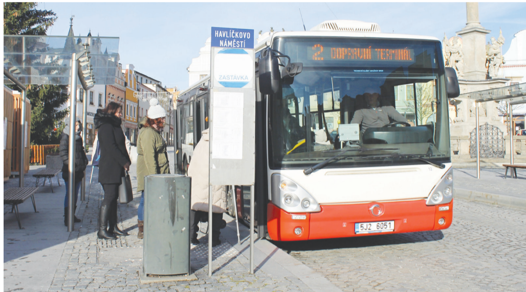
Linka č. 2 bude nově od března opět objíždět celé město tak, jako bývalá „okružní“ linka č. 8

Vedení města se proto znovu zabývalo touto problematikou a na základě vyhodnocení shromážděných připomínek cestujících, provozních poznatků a údajů z reálného provozu po prosincovém spuštění nového systému schválila Rada města na svém jednání 9. února změny v jízdních řádech. „Od března přidáme do stávajícího systému další spoje, po kterých nejvíce volá veřejnost. Přibudou okružní spoje na trase Žižkov – Výšina – Nový hřbitov – Nemocnice – Perknov a zpět,“ vysvětlil mí-