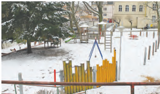
Dosluhující dětské hřiště za budovou AZ centra (bývalá ZŠ Rubešova) se dočká výrazných změn

V těchto dnech město Havlíčkův Brod zahájilo dlouho očekávanou revitalizaci parku Budoucnost. Její první etapa začala odstraňováním zhruba 60 starých, nemocných a poškozených stromů. Dalších zhruba 400 stromů projde odborným arboristickým zásahem.