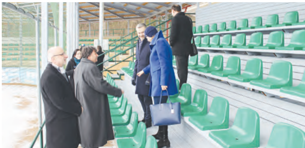
Hosté si se zájmem prohlédli novou tribunu v Hippos Areně

Rekonstruovaný areál bude sloužit nejenom k mistrovským zápasům, ale i k běžným tréninkům, srazu reprezentace a přípravným zápasům reprezentačního mužstva. Již v tomto roce se nřinravuje mezi-