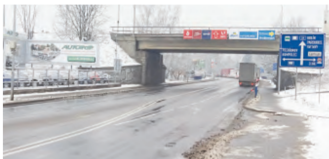
Dvojitá plná čára na silnici I/38 brání vjezdu a výjezdu na pozemek ze směru na Jihlavu

tém pozemku o ploše 3899 metrů čtverečních bude postaven nový obchod pro kutily. Pozemek patří soukromému vlastníkovu a výstavba prodejní haly je investicí