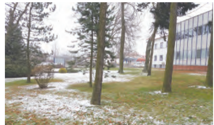
Park bude upraven

mová zóna, a proto bychom chtěli parčík otevřít každému. Plánujeme udělat úpravy trávníku, obnovit starou fontánu, přidat lavičky a vytvořit nové cestičky. Doplníme i mobiliář. Třeba lavičky už máme nakoupené.“