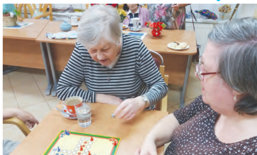
Pracovnice Astry - denního centra pro seniory v Humpolci připravují pro seniory také nejrůznější společenské aktivity.

Vlna chřipkových onemocnění však jednu ze služeb havlíčkovobrodské Charity postihla, a to tepr-