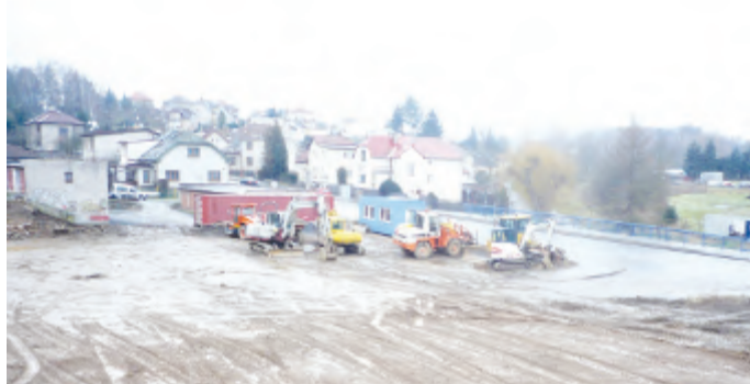
Příprava pozemku pro výstavbu prodejní haly

Při výjezdu z Havlíčkova Brodu po ulici Lidická směrem na Jihlavu je možné vidět hned za železničním mostem vlevo stavební práce. Na dosud nevyuži-