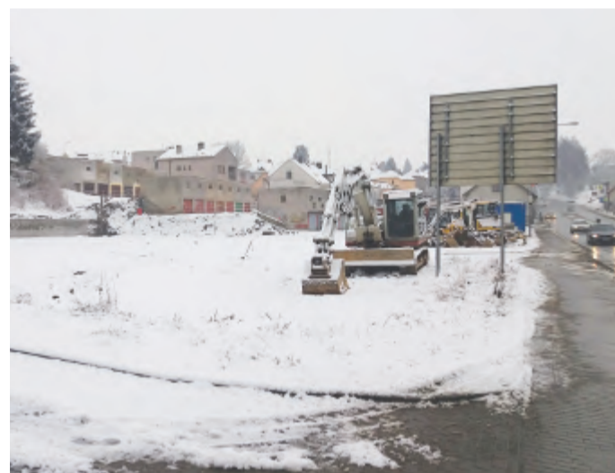
Sníh nebrání stavebním úpravám