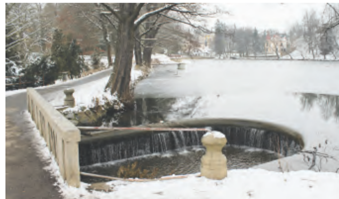
Do první etapy revitalizace je zahrnuto i okolí rybníku Hastřman