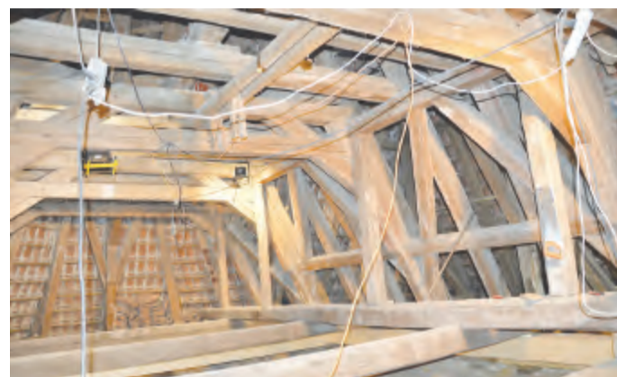
Tak vypadá již z části opravená konstrukce krovů při pohledu z půdy.