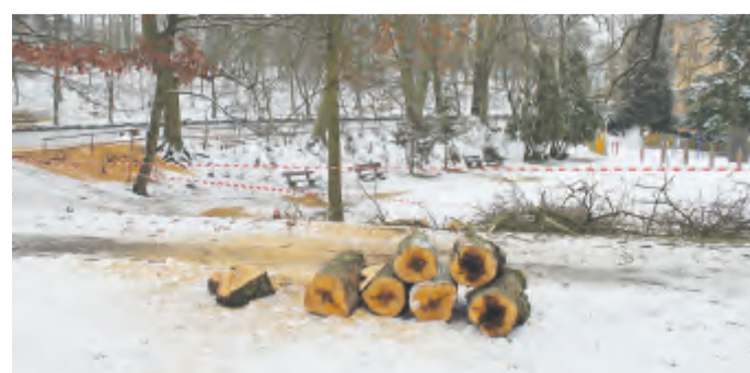
Nově budou zpevněny plochy za AZ centrem