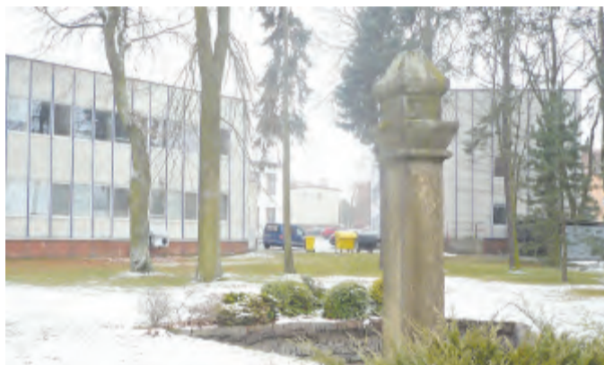
Obnoví se stará fontána

Havlíčkův Brod (jab) Firma Pleas má ve svém areálu více než 110 let parčík, který je oplocen a není přístupný veřejnosti. Tato situace se možná brzy změní. „My ten park nevyužíváme. V blízkém okolí není žádná kli-