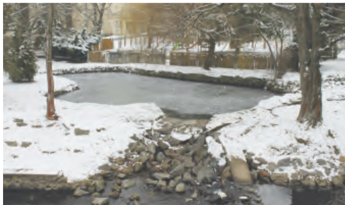
Úpravy se dotknou také malého rybníčku Očko v sousedství dětského hřiště