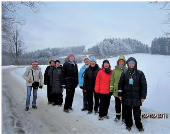
Jdeme k Velešovu

byla docela dobře schůdná, občas kolem nás projelo několik aut a tak jsme se po chvíli chůze blížili k nejvyššímu bodu dnešní trasy, k Velešovu. Okolí Velešova je známé studeným, sychravým a větrným počasím s velkým množstvím sněhu. A my jsme se na ty sněhové závěje, krásné jinovatky a mrazivý vítr docela těšili. Cestou k Velešovu začalo lehce pršet. Studený, mrazivý vzduch způsobil to, že dešť nám namrzal na bundy a vytvořil na nás ledovou krustu. Velešov nás opravdu nezklamal. Míjeli jsme zaváté stromy, obalené krásnou jinovatkou, závěje vysoké 4 metry, z kterých vykukovaly jen špičky telefonních sloupů. Závěje kolem silnic nám připomínaly rozbourěné sněhové moře s vysokými vl-