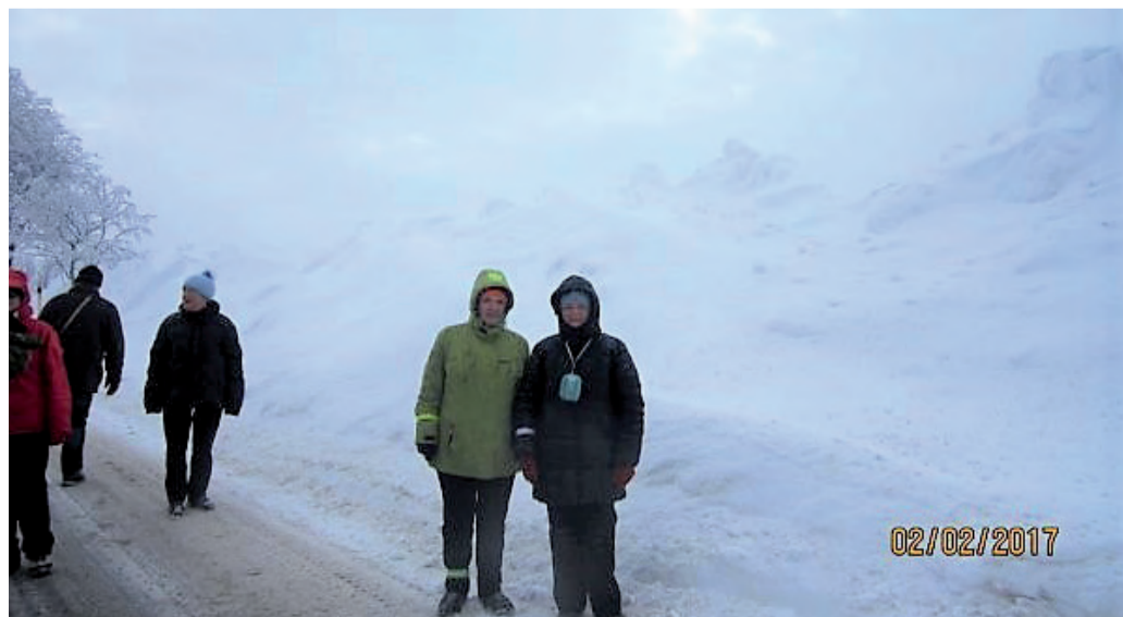
Vypadá to jako rozbourěné sněhové moře