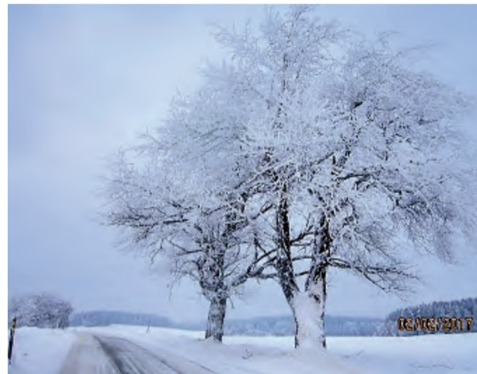
Krásně ojíně stromy kolem silnice