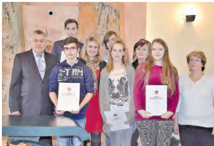
Společné foto vítězů a gratulantů

Žáci ze Základní školy Komenického se v několikatísícové konkurenci na Mistrovství ČR v deskových hrách skvěle prosadili, když ve hrách Rummikub, Quoridor a Quatro uhráli převážně zlaté, stříbrné a bronzové pozice.