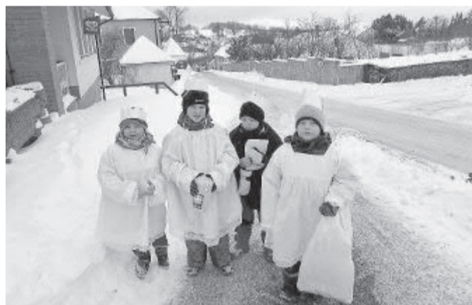
Na organizaci Tříkrálové sbírky se podíli také učitelé a školáci ze Základní školy a Mateřské školy Krásná Hora.

Dodal, že počasí dělalo vrásky na čele i hudebníkům. V příbyslavském kostele se totiž každoročně koná Tříkrálový koncert, jenže mrazivé počasí zrovna dvakrát nepřálo ladění nástrojů. „Proto jsme se rozhodli koncert přesunout do farního sálu. Nakonec ale