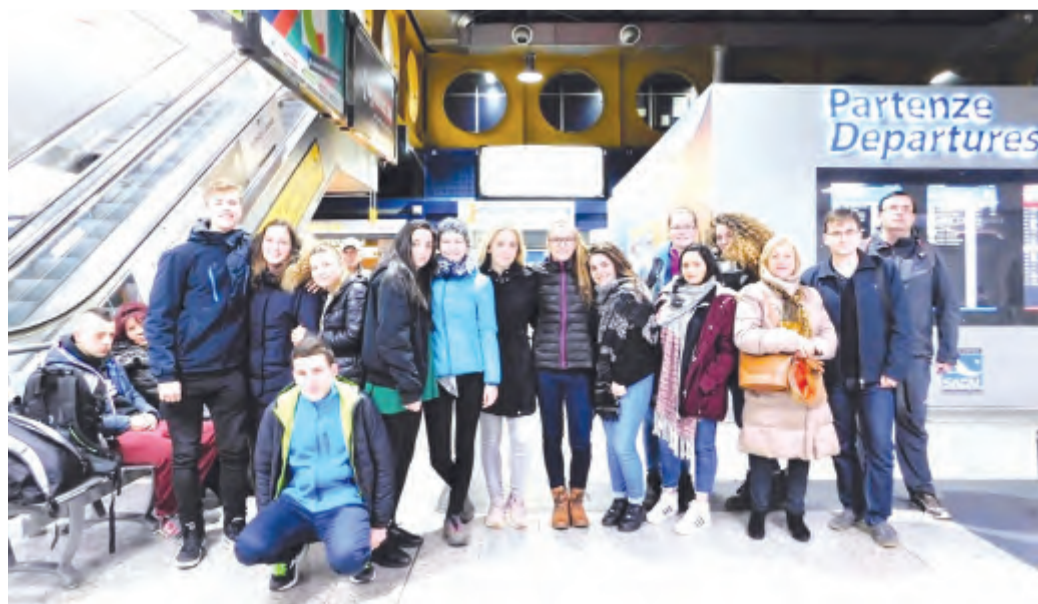
Závěrečnou tečkou pro nás byl přelet zasněžených Alp, ze kterých se chvílemi až tajil dech (z textu Vít Daňka)