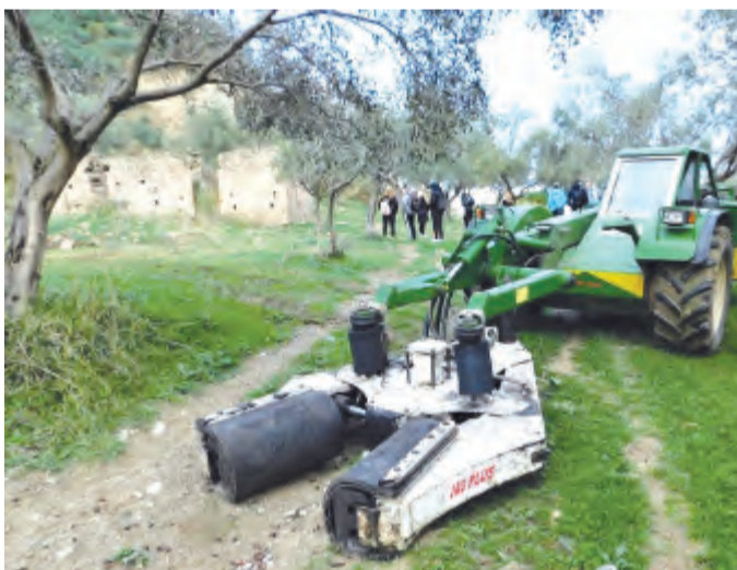
K pracovní části cesty patřila i návštěva výroby olivového oleje, kde účastníci viděli, jak se olivy sklízí, jak se zbavují pecek a jak se z nich následně lisuje olivový olej

Pozn.redakce: pro ilustraci vybíráme závěr z textu Vít Daňka z 2.D: „... Tento výlet mě určitě velice obohatil o novou životní zkušenost. Našel jsem si mnoho nových kamarádů, poznal nová