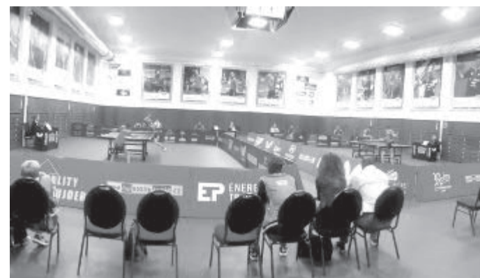
Pohled do Arény HB Ostrov Havlíčkův Brod