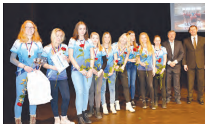
Úspěšné družstvo volejbalových kadetek TJ Sklo Bohemia Světlá n. S. v loňské sezoně suverénně vyhrálo krajský přebor a vybojovalo si také účast v I. lize kadetek

Ani při letošním slavnostním ceremoniálu organizátoři nezapo-