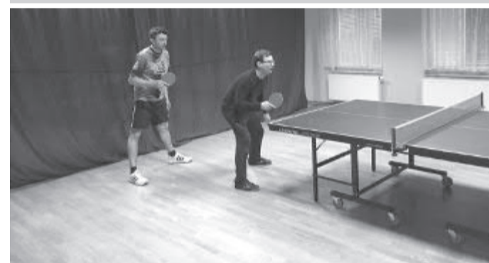
Ilustrační foto (mac)