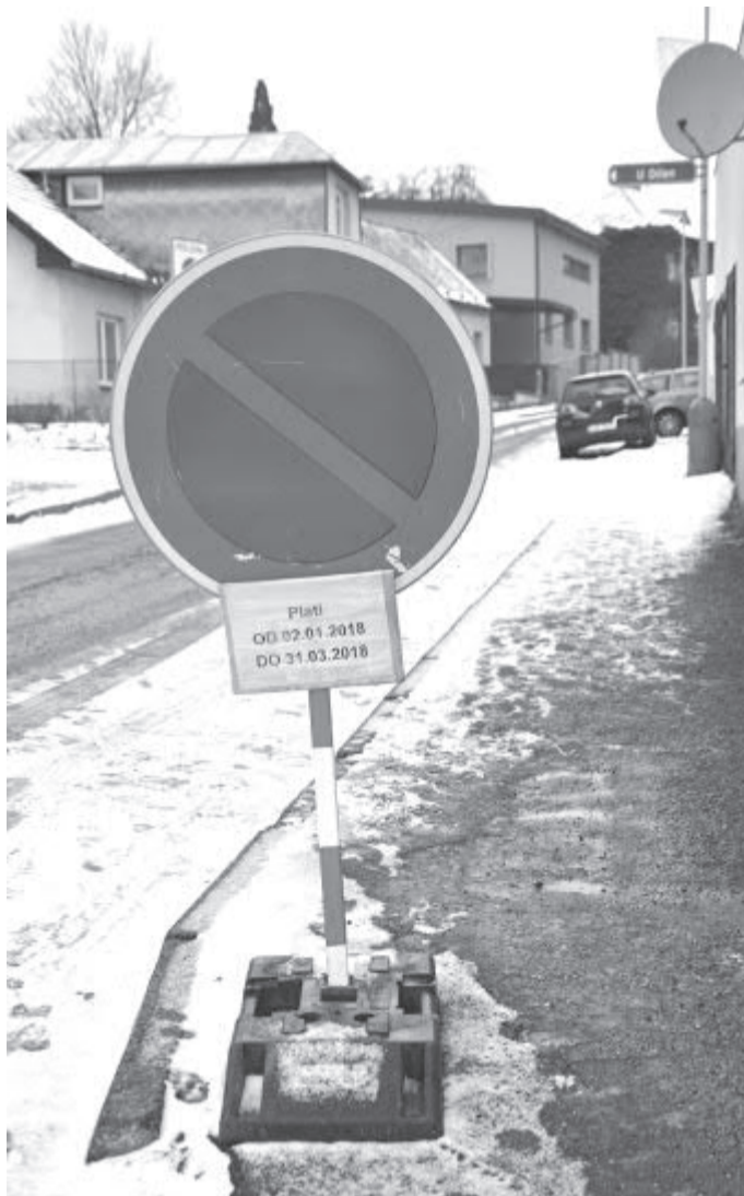
Přenosná značka na začátku Kolovratovy ulice

Stejně jako v předcházejících letech rozmístili před časem pracovníci příspěvkové organizace Technické a bytové služby města Světlá n. S. přenosné dopravní