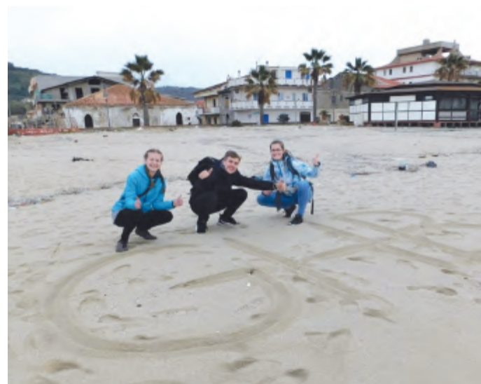
Našla se i chvilka na cestu k moři, kde upoutal zejména nezvyklý pohled na liduprázdné pláže