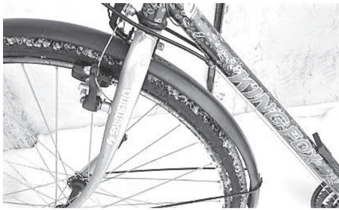
Chotěboř (MP) - V půli ledna bylo v sídlišti Na Chmelnici nalezeno pánské jízdní kolo. Majitel, nechť se obrátí na strážníky naší městské policie. Z taktických důvodů uvádíme jen dílčí obrázek nalezeného kola.