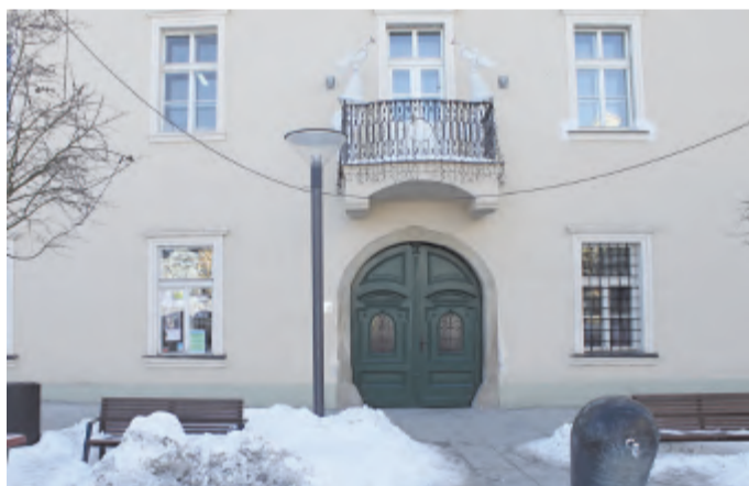
Čtenáři už si zvykli chodit za knihami, hudbou i kulturními pořady do sídla knihovny v budově Staré radnice.