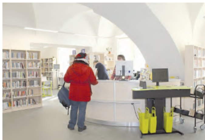
Vypůjčit si knihy můžete i v sobotu dopoledne.