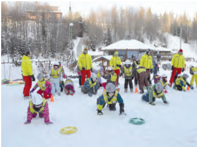
Kvalifikovaní instruktoři provádějí lyžařský výcvik dětí