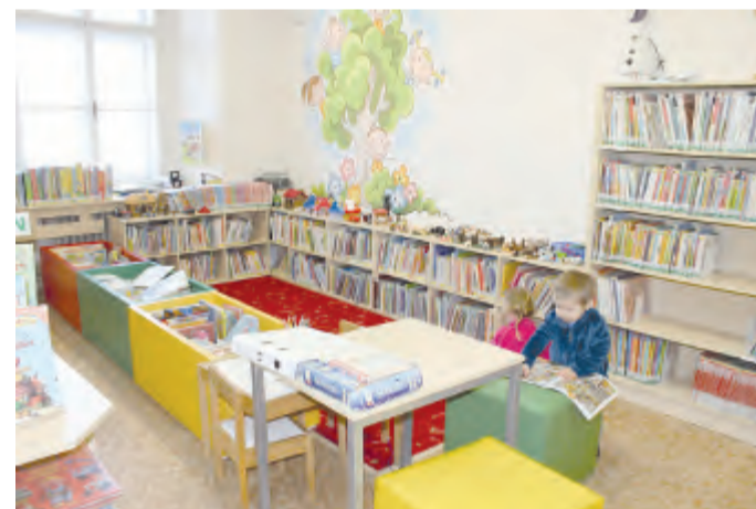
V dětském oddělení je pěkný koutek i pro ty nejmenší.