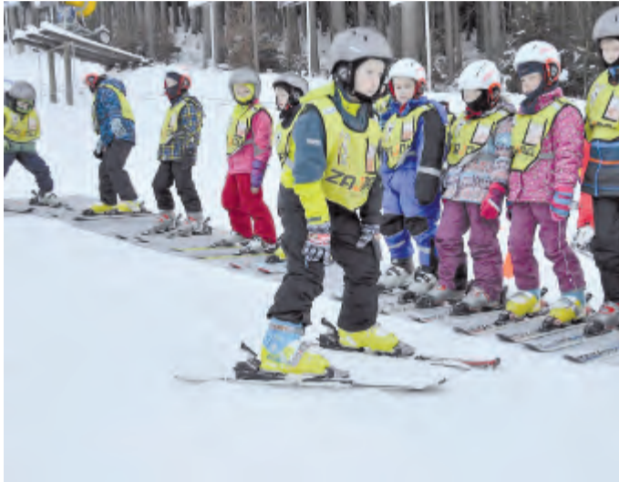
Děti zvládají lyžařské základy

Lyžařský výcvik v ZŠ a MŠ Štoky probíhá po skupinách. 2. stupeň ZŠ jezdí v březnu do Orlických hor. Škola zajišťuje ve vlastní re-