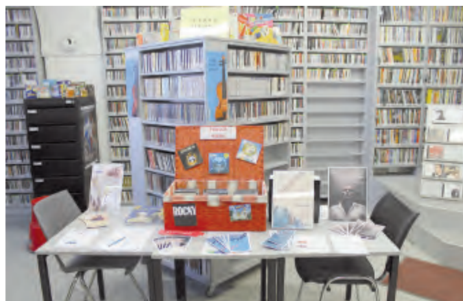
M-centrum je ale především zásobárna dobré hudby a klidný koutek pro malé besedy.

V letošním roce slaví Krajská knihovna Vysočiny 15 let od svého vzniku. V lidském životě patnáct let znamená, že z malého miminka dítě dospěje v pubertáka s vlastní občankou.