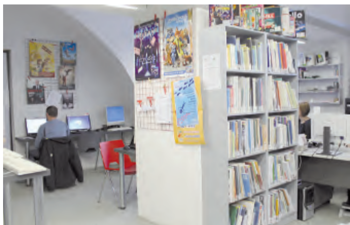
V m-centru je k dispozici hojně využívaný veřejný internet.