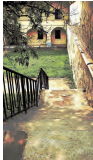
Schody do tajné zahrady

Digitální technika zaznamenala velký skok i ve fotografii. Předností proti analogové fotografii je určitě snadné pořizování fotek buď fotoaparátem, mobilem nebo tabletem. Nastává ale problém, kam ukládat nepřehledné množství fotek. „Všechny své fotografie mám v počítači. O Vánocích jsem dostala My Cloud, tak budu přesouvat a pořádně zálohovat. Rajčenet používám, ale spíš na sdílení fotek s přáteli ze společných akcí. Z rodinných fotografií dělám pravidelně fotoknihy a občas nějakou zvětším do rámu a na zed' s ní. Nyní se mi zalíbil tisk na plátno, tak to chci vyzkoušet,“ poradila možná i čtenářům týdeníku