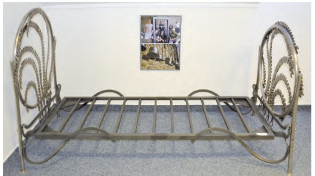
Postel (Roman Pešl)