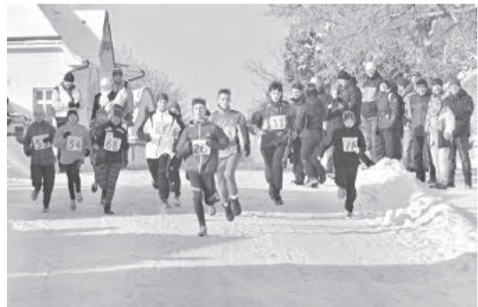
Start běhu mladšího a staršího žactva