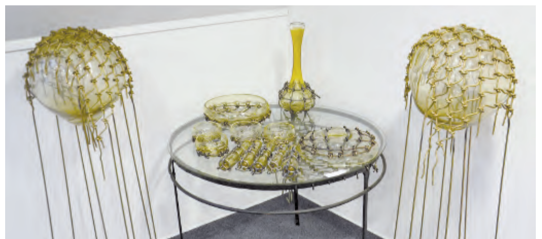
Práce Jana Tomeška