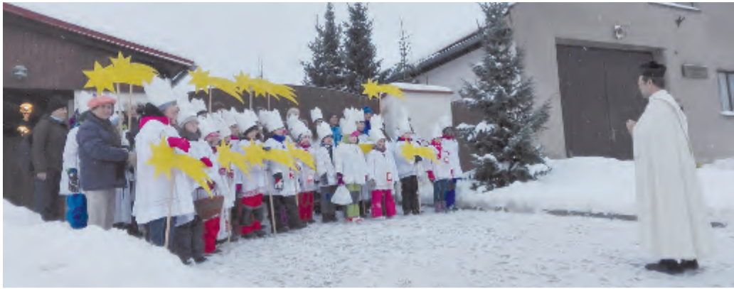
Tříkrálová sbírka 2017 v Českě Bělé