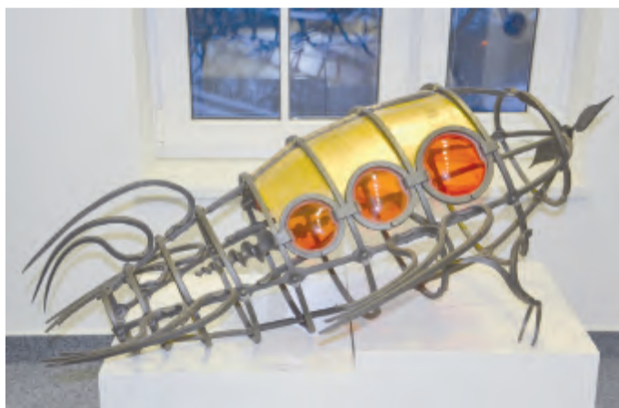
Vzducholod' (Marek Škramovský)