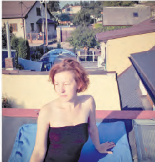
Vítězná fotka v kategorii „Staré a nové“ s názvem „1963 máma – 2016 dcera“