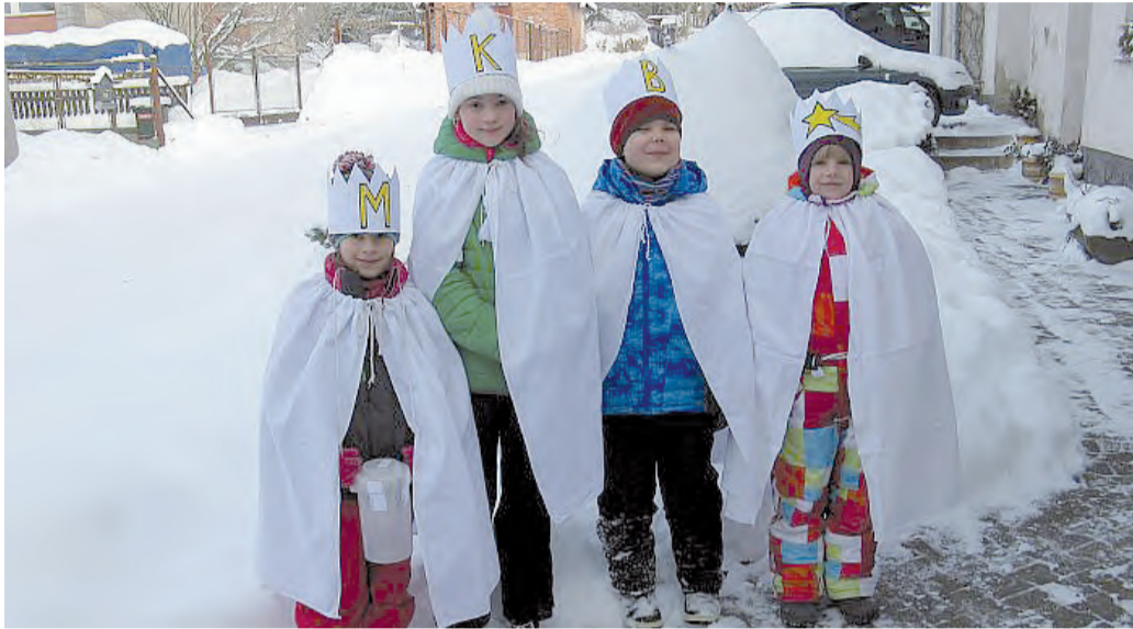
Při Tříkrálové sbírce ve Ždírci n. D. bylo vybráno 67.282,- Kč