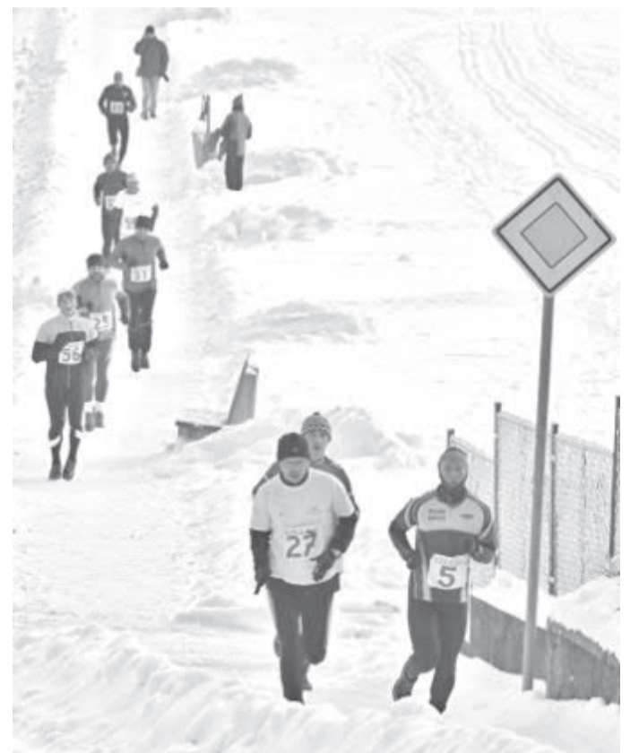
Hlavní běh na 4,6 km