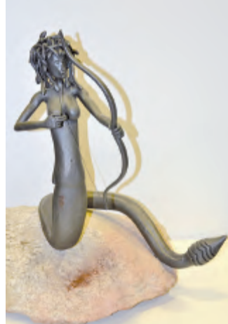
Medúza (Lukáš Zdražil)