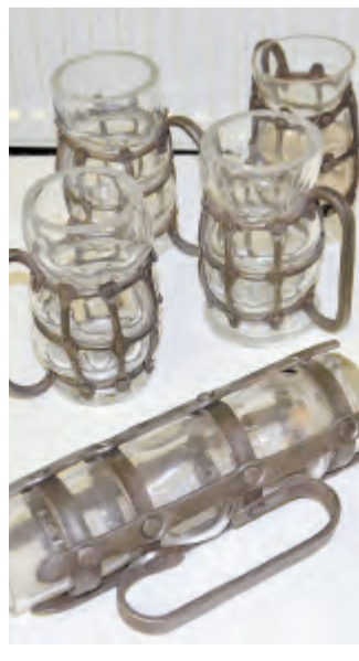
Nápojové sklo z kombinace skla a železa