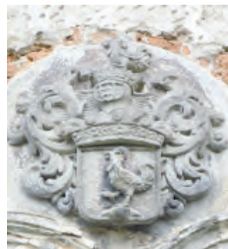
Znak Strakův z Nedabylic nad hlavním vchodem do zámku

Autorem okrouhlického znaku je heraldik Zdeněk Velebný (*1957), rozhodnutí č. 104 je z 9. dubna 2002. Popis znaku: Zlatá hlava štítu oddělená černou ostrvici pěti suchých od modré části štítu, ve zlaté