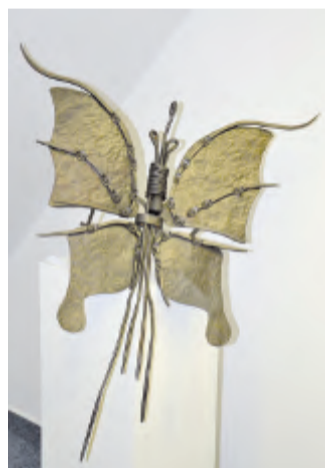
Motýl (Zbyšek Zúbek)