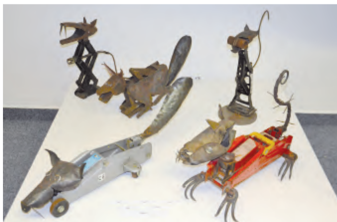
Heverky - z různých heverů a od různých autorů