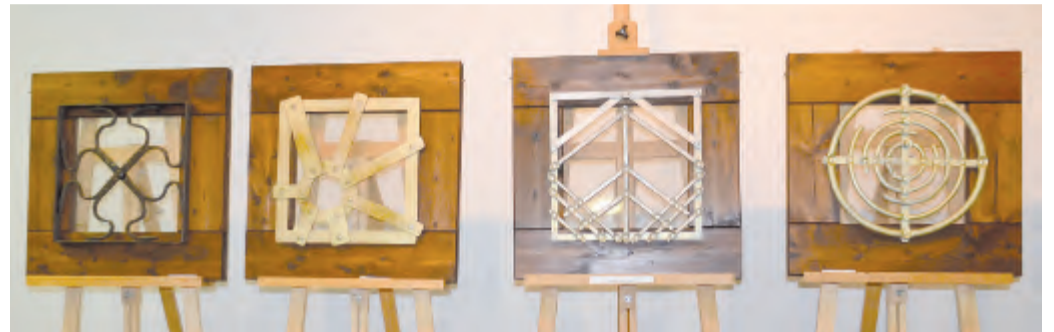
Vizirovací vratové mříže