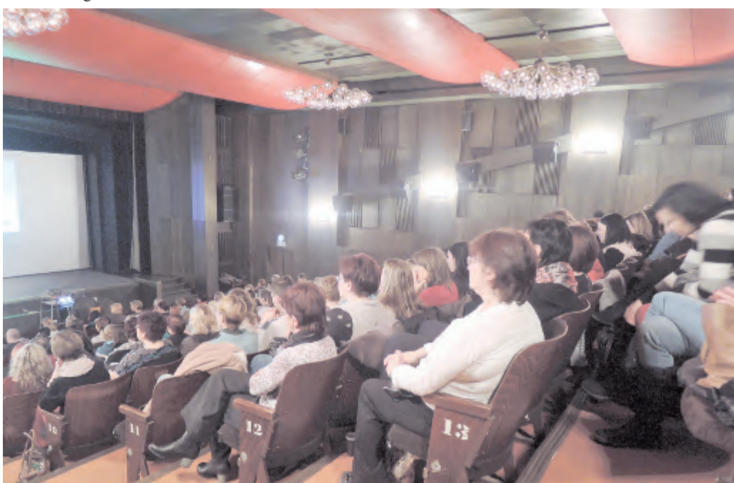
Účastníků konference bylo skoro 300