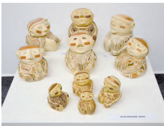
Repliky sošek mexických bůžků