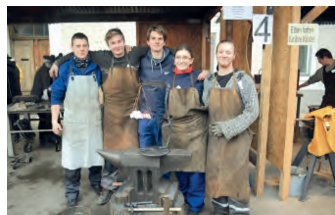
Radost z dobře provedené a oceňované práce

(převzato z webu školy, redakčně kráceno)