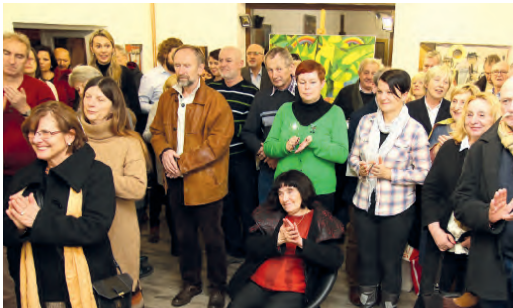
V přibyslavské Janáček galerii se sešlo početné publikum