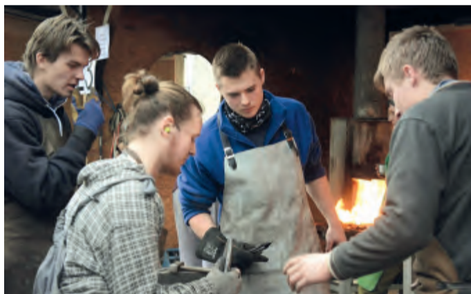
Kovářští učni jsou zaujati společným úkolem