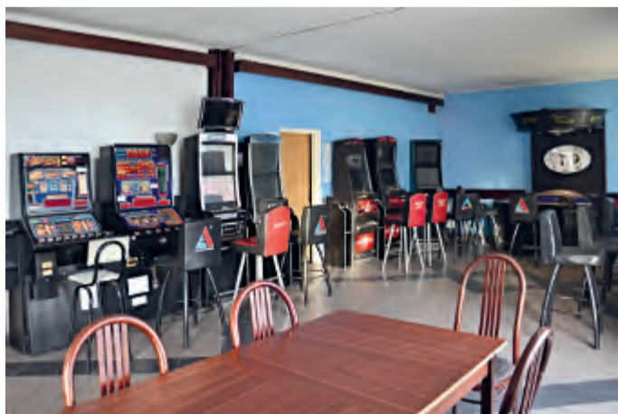
Stav 23. listopadu 2017

Velké písmeno Č dává tušit, že nejde o naši měnu, ale o restauraci (a dříve hotel) v Nádražní ulici ve Světlé nad Sázavou.