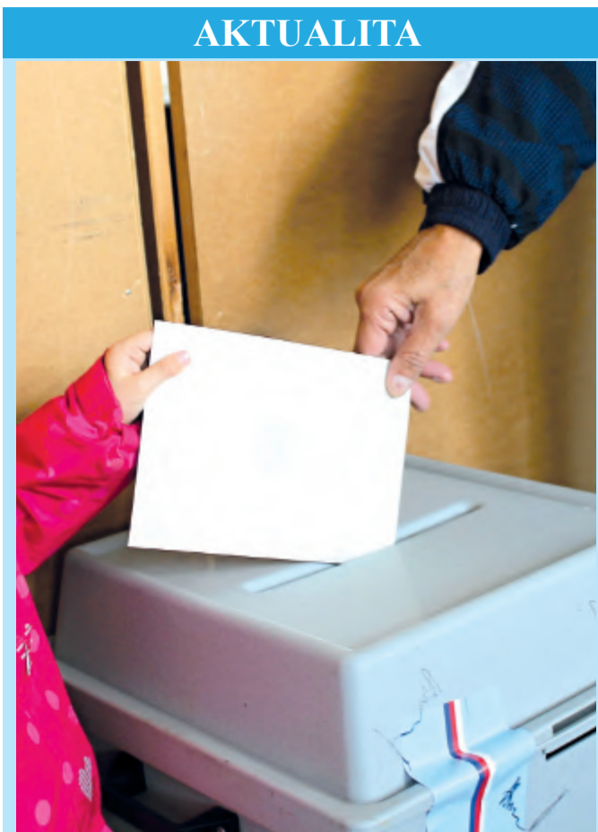
Z prvního kola voleb postoupili Miloš Zeman (38,57%) a Jiří Drahoš (26,6%). Jednomu z nich můžete dát svůj hlas ve druhém kole voleb, které se uskuteční v pátek 26.1. a v sobotu 27.1. na stejných místech a ve stejných časech. (mal)