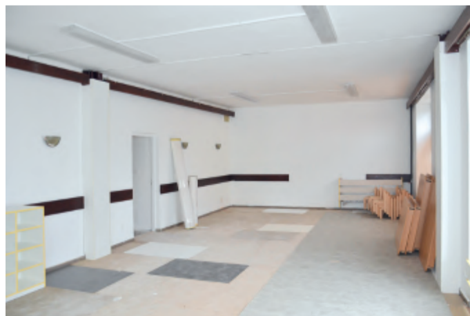
Stav 12. ledna 2018

te, spočívající v pravidelné péči o dítě od 2 let do zahájení povinné školní docházky, a to v kolektivu dětí mimo domácnost dítěte. Dětská skupina poskytuje výchovnou péči, zaměřenou na rozvoj schopností dítěte a jeho kulturních a hygienických návy-