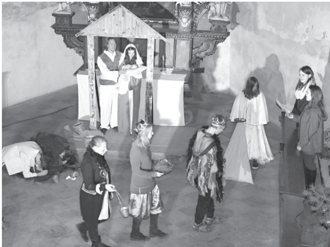
Představení Živý Betlém v kostele sv. Kateřiny se setvalo s velkým zájmem návštěvníků a přineslo do kasiček tisíce korun.

Členové havlíčkobrodského spolku Epigram, který byl oficiálně zapsán teprve na podzim loňského roku, se hned pustili do práce - vyhlásili Veřejnou sbírku na obnovu kostela svatě Kateřiny a zároveň ve spolupráci s divadelním spolkem Dinosaur - Adivadlo, a.s. uspořádali dvě benefiční představení s názvem Živý betlém, které se konalo v kostele svatě Kateřiny o druhé a