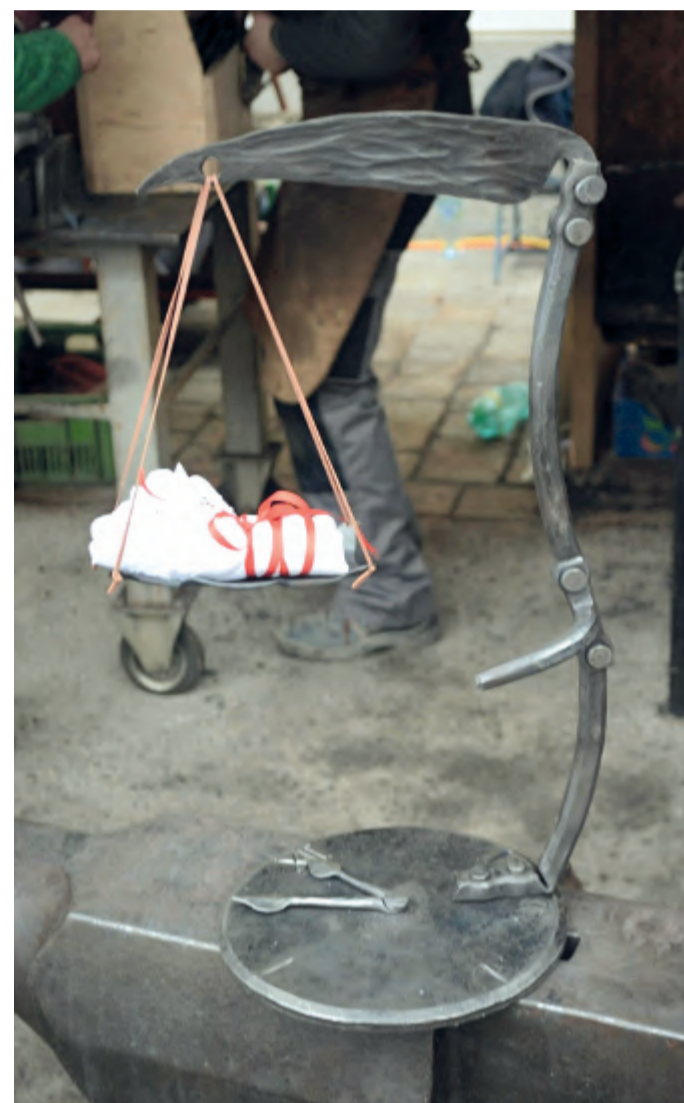
Hotová plastika na téma Kruh se uzavírá s názvem „Born to Die“ (Zrozen ke smrti)