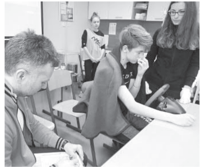
Modelová situace - poranění řidiče

ním bazénku, druhý se popálil o gril a třetí upadl do bezvědomí.